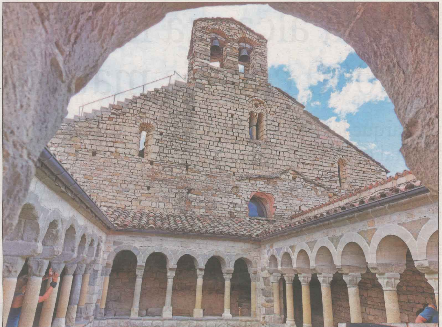
El claustre de la Col·legiata de Santa Maria de Mur i el seu campanar d'espardenya