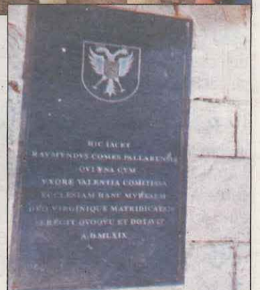
Davant l'absis hi ha la tomba del Comte Ramon V

El fundador de la Col·legiata va ser enterrat a la pròpia església. Les pintures també donen fe de que va ser el seu propi cosí el que el va matar.