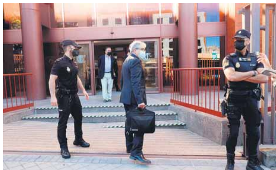
Homs al juny al Tribunal de Comptes, al carrer Torrelaguna, 79 de Madrid