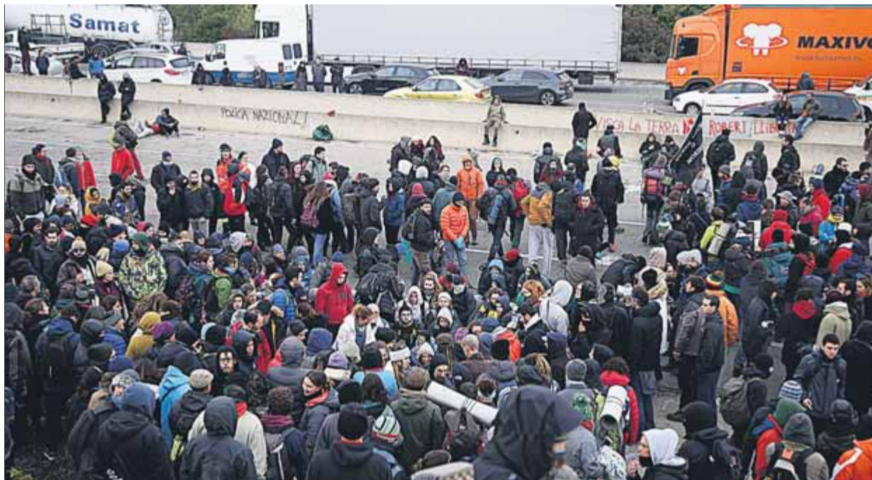
Manifestants a l'AP-7, a l'altura de Salt, el novembre del 2019

Alerta Solidària va qualificar aquest recurs de la fiscalia de “nova decisió