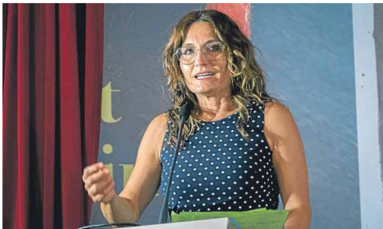
La consellera de la Presidència, Laura Vilagrà, durant la seva intervenció ahir a Prada