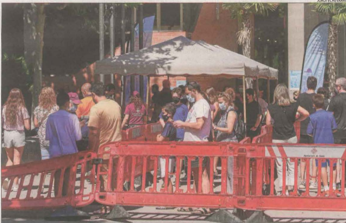
Cues davant del pavelló Onze de Setembre de Lleida per rebre la vacuna.