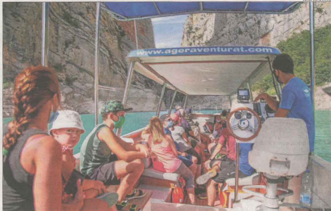
Les barques plenes de visitants van tornar a solcar les aigües de Mont-rebei.