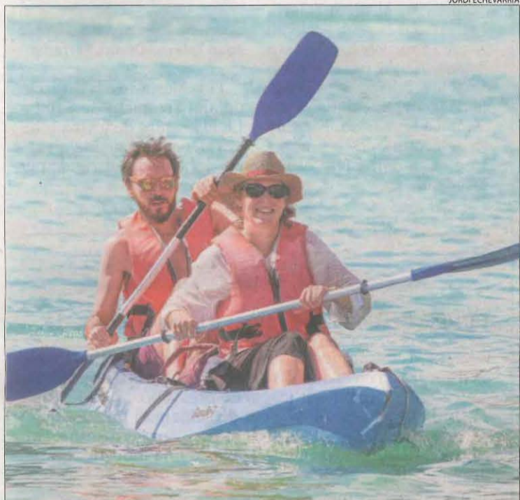
Turistes remant al congost ahir a la tarda.

Suspesa vuit dies per les obres per assegurar la paret del congost a Àger després dels desprendiments del novembre || Tornen els viatges dins de la gorja i l'activitat per a set empreses de la zona