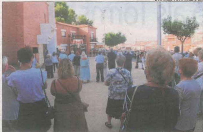
Desenes de veïns van seguir el funeral des del carrer.