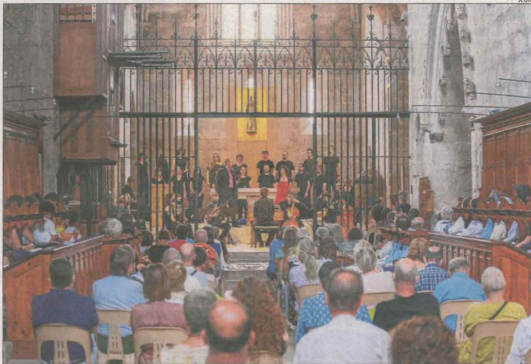
L'església (a la foto) i el claustre del monestir van ser els escenaris escollits.

El monestir de Vallbona de les Monges va acollir tres concerts en dos dies || Es va cantar òpera per primer cop en el certamen