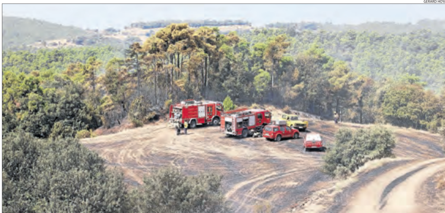
Bombers en l'incendi de vegetació que es va originar ahir de matinada a Vilaplana, nucli de la Baronia de Rialb.