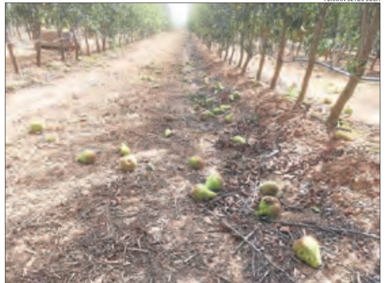
FERRAN SEYÓS SOLA

Pomeres víctimes de l'aire ■ Aquestes pomeres van acabar completament tombades per l'efecte del vent, que també va causar danys a les xarxes antipendra de la finca.