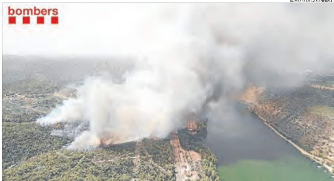
El foc forestal de la Pobla de Massalua afectava a última hora d'ahir 75 hectàrees de terreny.