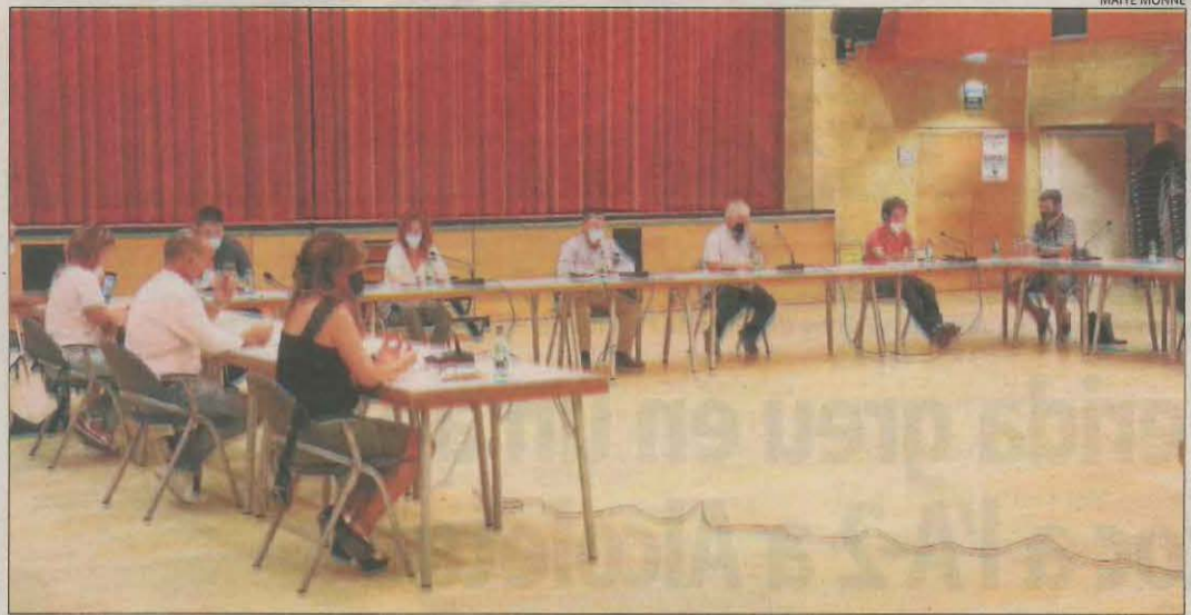
El ple extraordinari celebrat ahir a Alcarràs i que va durar menys d'una hora.

«Se m'ha linxat públicament i ningú no va moure un dit quan em van assetjar»