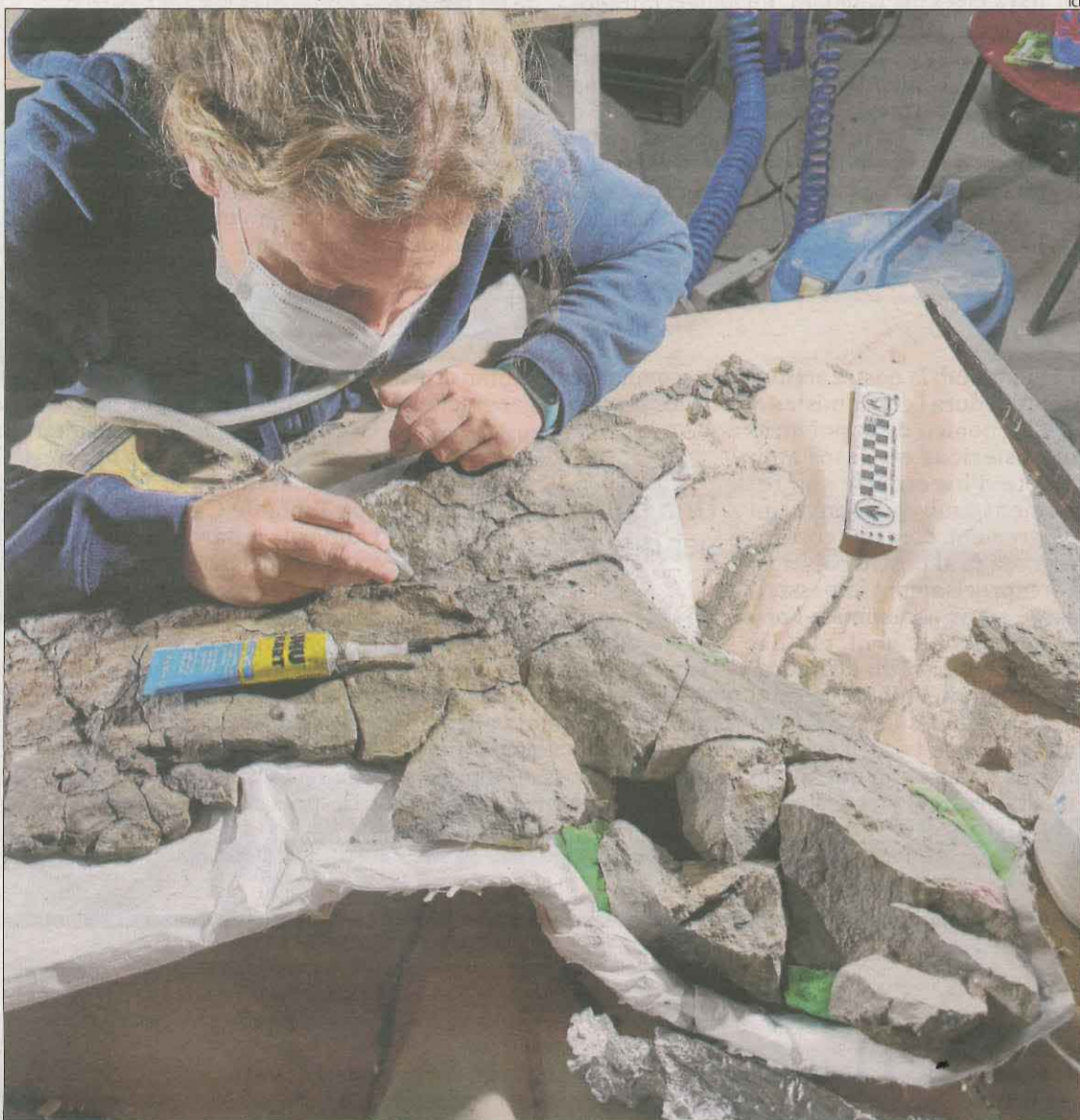
La restauració de les restes fòssils de la pelvis de la gran tortuga al museu Dinosfera.

La restauració de la pelvis de la tortuga es porta a terme a la Dinosfera i els visitants poden observar el procés. Una vegada finalitzin aquests treballs, està previst exposar-los al públic a les instal·lacions del museu Dinosfera a partir d'aquest mes de setembre.