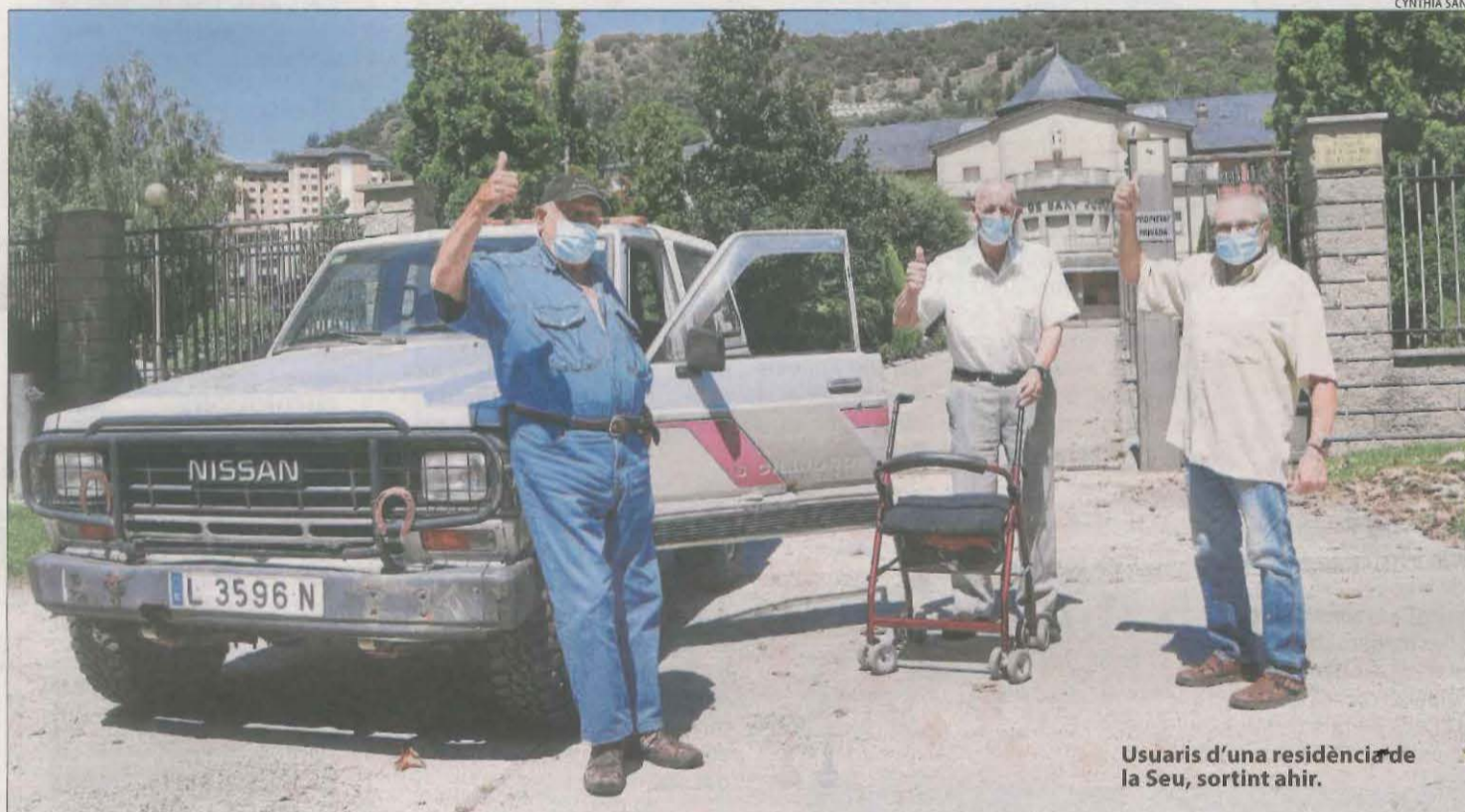
Usuaris d'una residència de la Seu, sortint ahir.