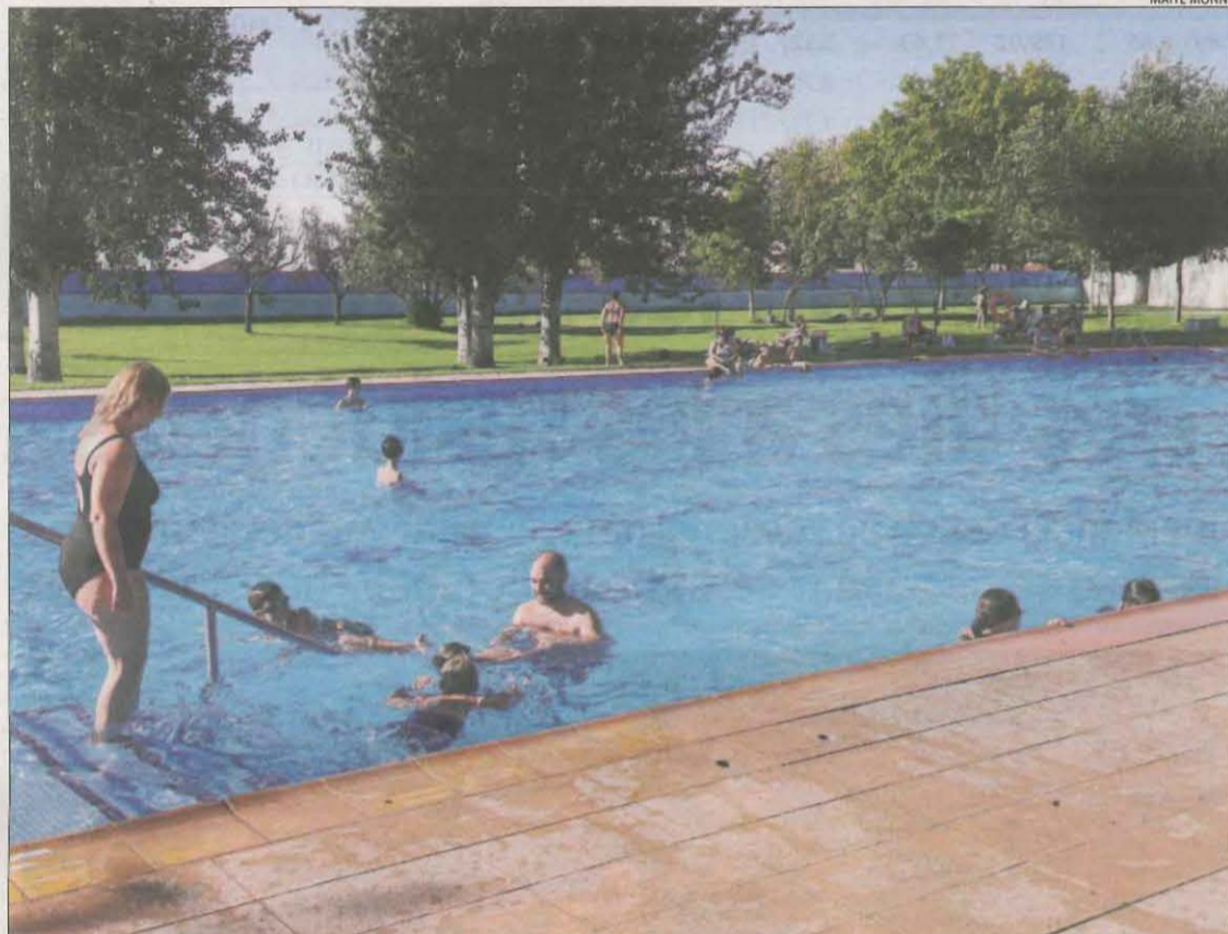
Banyistes ahir a la tarda a les piscines de Gimenells i el Pla de la Font.

Igual que en ocasions anteriors, la pròrroga de les restriccions s'haurà de sotmetre al vistiplau del Tribunal Superior de Justícia de Catalunya (TSJC).