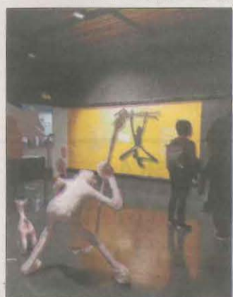
'El Solsonià', M. de Solsona.

In the beggining was... La primera exposició permanent a Europa de l'artista japonesa Chiaru Shiota. Permanent.