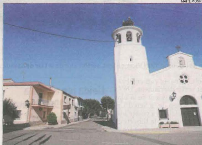
Carrers buits a mitja tarda al poble.

Unes altres dos veïnes tampoc podien creure's que el toc de queda s'apliqui al poble,