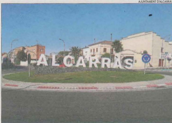
El rètol amb el nom d'Alcarràs a la nova rotonda.