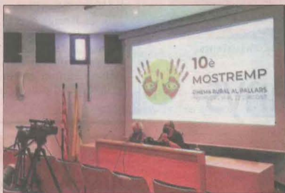
Tremp acollirà el festival de cine fins diumenge.