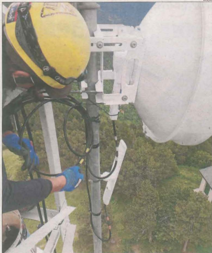
Una antena de radiofreqüència de la firma Wicat a la Vall de Boí.

Els primers contactes entre l'Estat i la Comissió Europea pretenen evitar que la proposta del Govern espanyol pugui interpretar-se a Brussel·les com una acció del sector públic que atempti contra el principi de lliure competència. En aquest sentit, l'argumentació estatal recalca que plantegen facilitar l'accés a internet únicament allà on no hi ha operadors privats que garanteixin un accés de banda ampla a la xarxa. Fonts del ministeri van afegir que la seua proposta tampoc interfereix amb el projecte de la xarxa