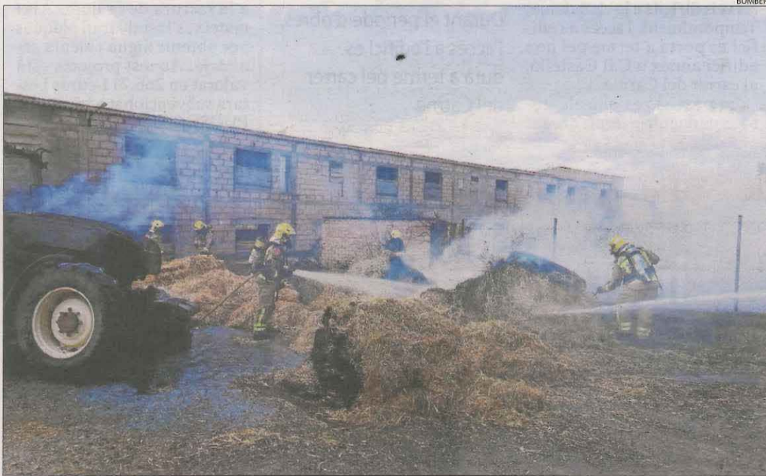
Els Bombers sufocant l'incendi a les bales de palla.

van donar ahir per extingit l'incendi que es va declarar dilluns a la tarda a Artesa de Segre (vegeu SEGRE d'ahir). El foc va ser a Montmagastre i va acabar calcinant 1,5 hectàrees.