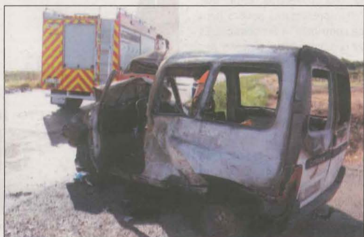
Estat d'un dels vehicles accidentats enguany

Pel que fa a les xifres de tot Catalunya, fins al 31 d'agost van morir 89 persones en 84 accidents de trànsit a les carreteres catalanes. Durant el mateix període de 2019 van perdre la vida 122 persones en 115 sinistres mortals en zona interurbana. D'aquesta manera, les dades d'enguany respecte al 2019 suposen un descens del 27% en el nombre de víctimes mortal. A més, cal indicar que en el mes d'agost van perdre la vida 14 persones a les carreteres catalanes, una dada que significa una reducció del 33,3% respecte l'agost del 2019, quan van morir 21 persones. Des del mes de maig, coincidint amb la fi de