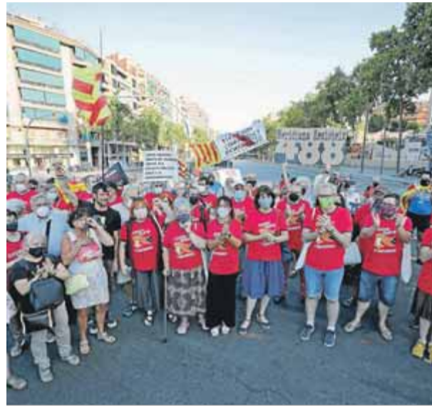
Presentació de la samarreta de la Diada, al juliol, durant un tall de la Meridiana

"L'Onze de Setembre vol tornar a situar la independència al centre del debat polític i empènyer els partits i les institucions a fer-la efectiva", va assegurar ahir l'ANC en un comunicat. ■