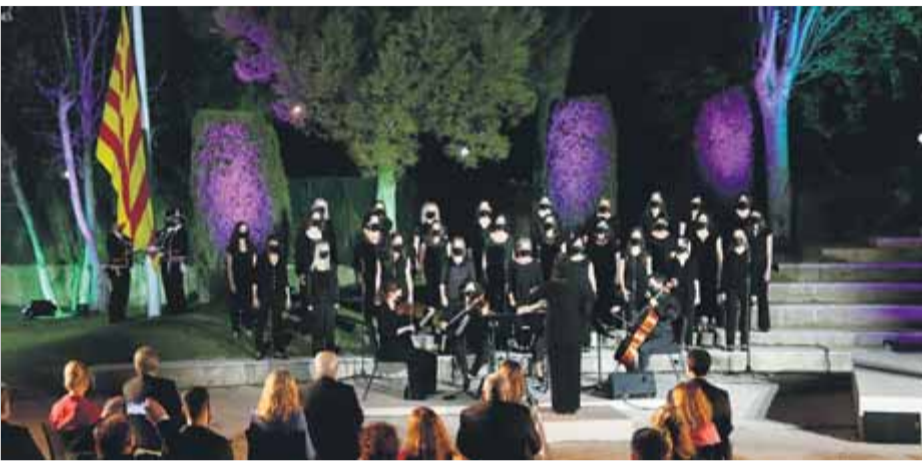
Actuació del Cor Zòngora durant l'acte de lliurament de les medalles