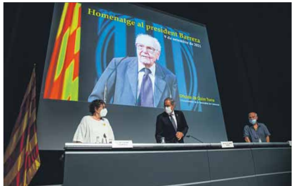
L’homenatge al president Barrera es va celebrar a l’Auditori Irla, a Girona