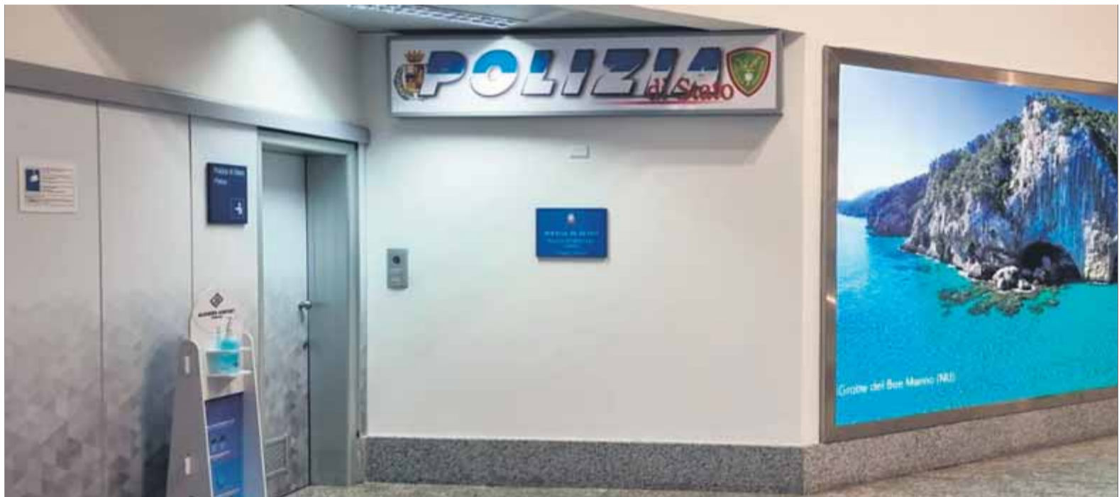
Les instal·lacions de la policia italiana a l'aeroport de l'Alguer, ahir a la nit després de la detenció del president ■

El president va ser retingut ahir a l'aeroport de l'Alguer per la policia fronterera italiana Els agents no van aclarir on el duien ni quins serien els tràmits en les pròximes hores