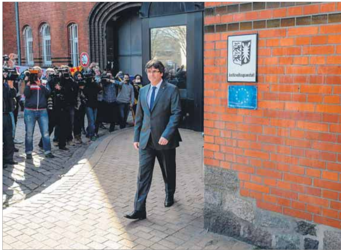
El president Puigdemont, el dia que va sortir de la presó. A sota, hi va tornar de visita al cap d'un any

Al cap d'un any, el president va visitar el centre penitenciari