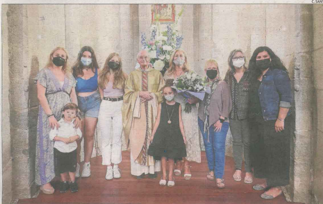
La Seu va fer ahir la tercera reunió d'Urgells.