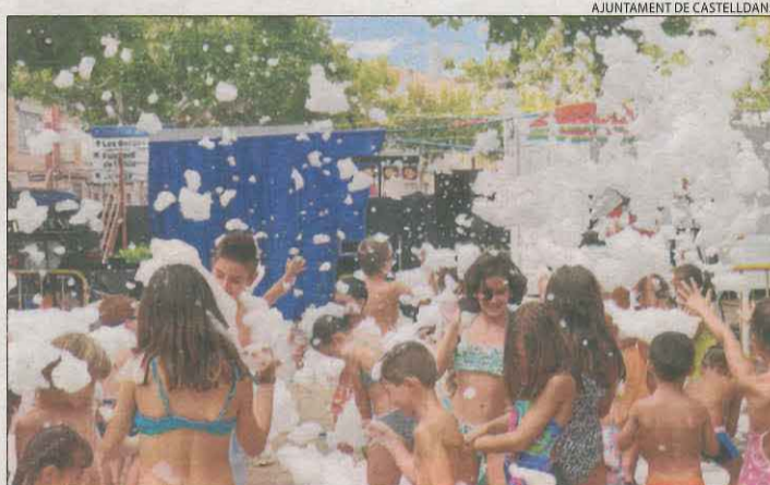
L'espectacle amb escuma celebrat ahir a Castellans.