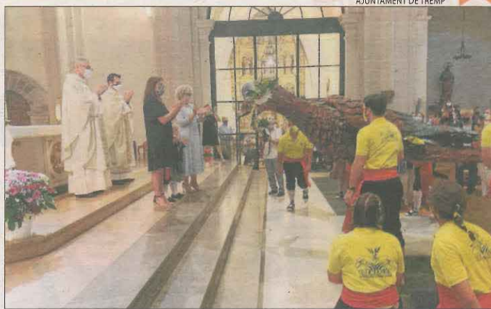
L'àguila Cremablat va participar en l'ofrena floral de Tremp.