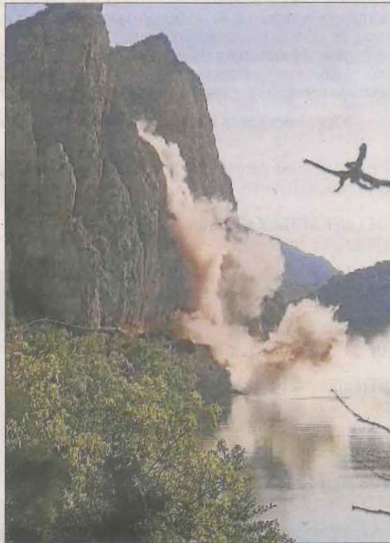
La seqüència de la caiguda de l'enorme roca des del cim del pendent fins al pantà de Sant Llorenç.

de pedres. També contemplen analitzar l'estabilitat del pendent mitjançant tecnologia d'ultrasons i altres procediments. Així ho van explicar fonts de la Diputació, que van apuntar que les noves contractacions per a la conservació de la xarxa provincial de carreteres incorporen estudis dels pendents pròxims a les calçades, així com plans d'intervenció que permetin conservar-los en condicions de seguretat. Cada empresa adjudicatària, van afegir, ha de por-