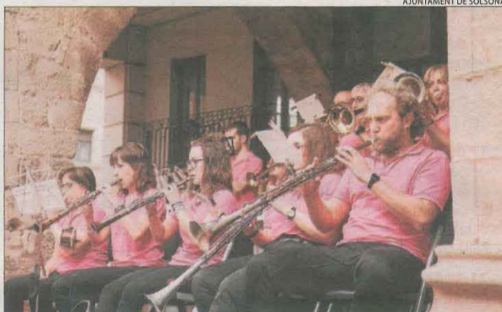
La Cobla Juvenil Ciutat de Solsona va ambientar els ballets.