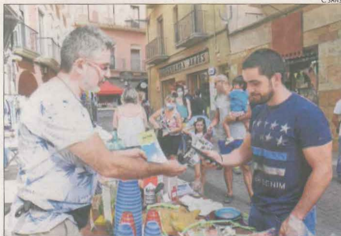
L'inici de la campanya es va sumar al dia de botigues al carrer.