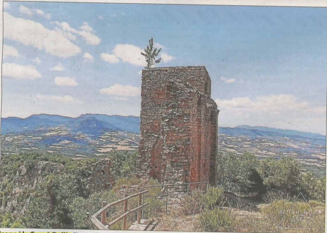
Isona i la Conca Dellà. El castell de Llordà, en aquesta localitat del Pallars Jussà, és d'origen romànic i la seua construcció data del segle XI. A la imatge, una fotografia de l'instagramer @arnau_ager.