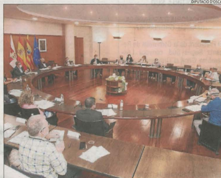
La reunió que es va celebrar ahir a Osca.

LLEIDA | Limitar el nombre de caiacs que poden navegar per Mont-rebei, delimitar-los trajectes i fixar horaris diferenciats per a aquestes embarcacions i les que transporten turistes. Aquestes són algunes propostes que es van plantejar ahir a Osca a la comissió que reuneix administracions lleidatanes i oscenques per regular aquest espai natural i evitar-ne la massificació. A la reunió es van presentar dades de l'estudi encarregat a la consultora Prames, que apunta que el congest rep més de dos mil persones alguns dies a l'any. Aquesta comissió ja va plantejar que estudia regular