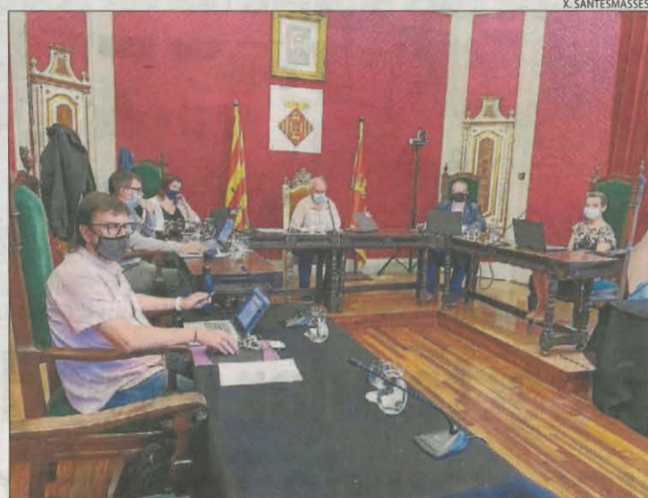
Imatge del ple celebrat ahir a la Paeria de Cervera.

També hi va haver total unanimitat del ple a una rebaixa del 50% de l'IBI durant quatre anys per als habitatges que optin per l'energia sostenible a través de la instal·lació de plaques fotovoltaïques. Cervera va ratificar així mateix els tributs locals per al 2022. Es congelen tots els impostos amb algunes excepcions com és el cas de l'Impost de Construccions i Obres (ICIO), que passa del 3 al 3,5 per cent. Segons Santacana, l'increment es produeix després de molts anys d'estar congelat. Malgrat