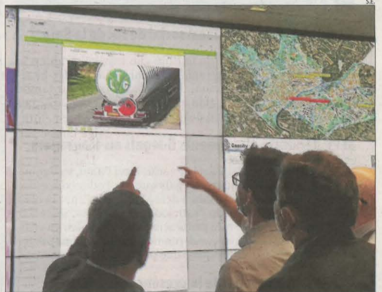
Imatge d'un vehicle captat per una càmera de l'Horta.

La Paeria ja ha engegat les primeres dinou càmeres de l'Horta que registren les matrícules dels vehicles. "Permetran millorar la seguretat global de la zona, controlar actituds incíviques i fets delictius, el trànsit, revisar el ferm i l'estat dels camins i poder actuar de manera més contundent davant dels abocaments il·legals", va afirmar l'alcalde, Miquel Pueyo. El 2020 es van registrar 49 robatoris i furtos a l'Horta i aquest any ja són 41. Es van obrir 14 investigacions per abocaments i es va identificar 8 persones, a les quals s'obrirà expedient sancionador, i 7 aquest any. El tinent d'alcalde Toni Postius va