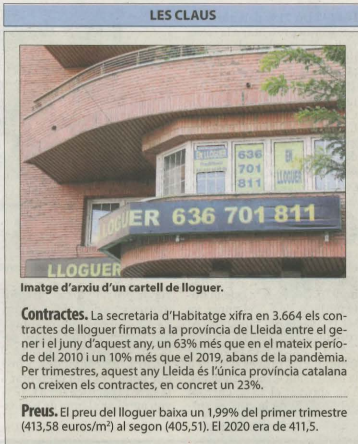
Imatge d'arxiu d'un cartell de lloguer.

Per comarques, el segon trimestre d'aquest any augmenten els contractes al Segrià (de 702 a 1.043), Garrigues (de 25 a 35), Noguera (de 101 a 120), Pallars Jussà (de 38 a 54) , Pla d'Urgell (de 136 a 172), Val d'Aran (de 15 a 19) i lleugerament a l'Urgell (de 192 a 194). En canvi, l'Alta Ribagorça manté la mateixa xifra de set contractes en els dos trimestres i baixen a la resta