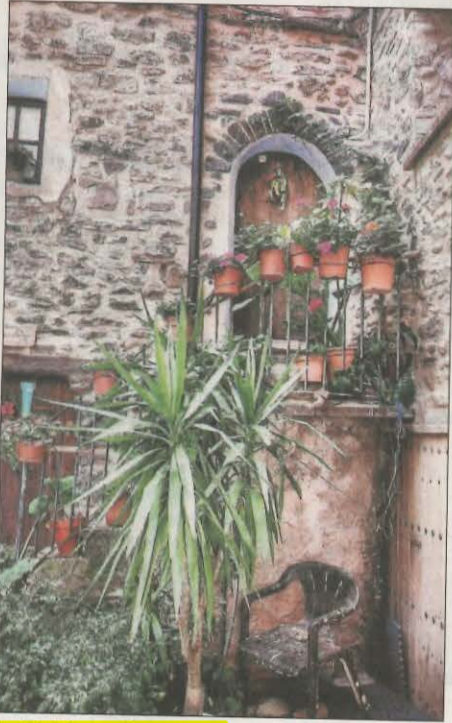
La Pobleta de Bellvei. Bonic record d'aquesta població del Jussà. @rouspascu.