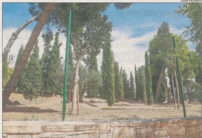
Els pals on aniran les malles que tanquen el recinte.