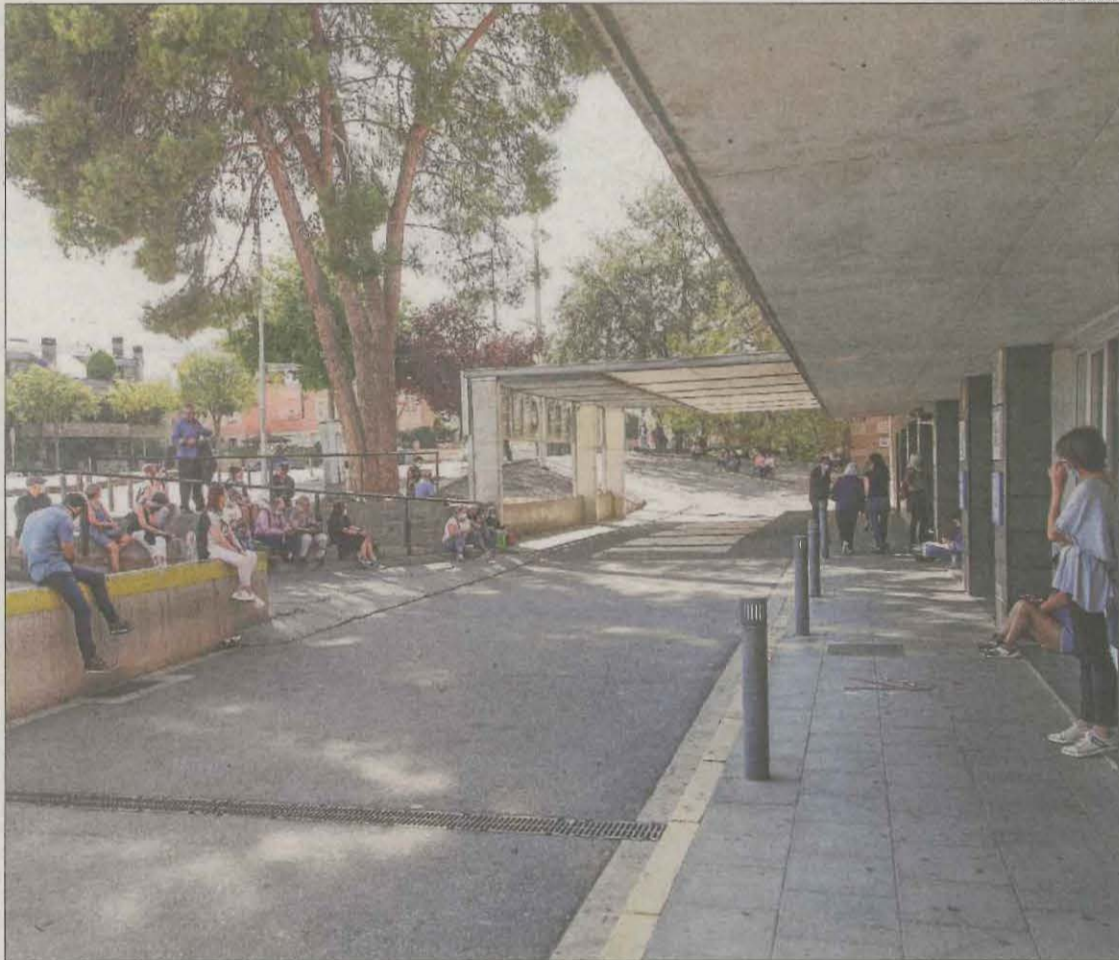
Acompanyants de persones que van anar ahir a Urgències, mentre esperen fora.

Depenent de si hi ha molta gent o no, els acompanyants poden esperar dins durant el matí, però ahir a les 11.30 van haver de sortir, mentre que fa uns dies va ser a les 12.00, encara que hi ha dies que ni a les 10.00 no es pot esperar dins. Tot i així, personal del centre va explicar que sí que es deixa entrar acompanyants de dependents. "La solució no és fàcil per la Covid i l'escassetat d'espais disponibles", van afegir, mentre que des de la direcció de l'Arnau es van limitar a dir que les queixes s'han de formalitzar a la Unitat d'Atenció a l'Usuari.