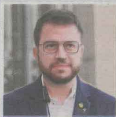
President de la Generalitat

«La seguretat de la Mercè la dissenya l'ajuntament. Cadascú ha d'assumir la seua responsabilitat»