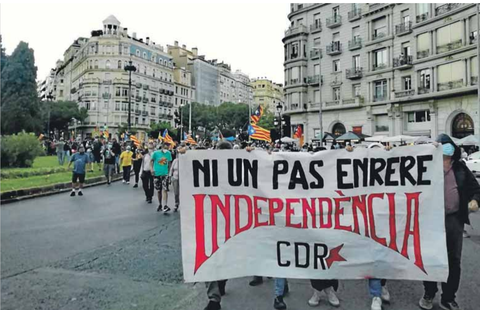
L'arrencada de la manifestació de divendres, a Francesc Macià, que va ser convocada pels CDR en commemoració de l'1 d'Octubre ■ JPF