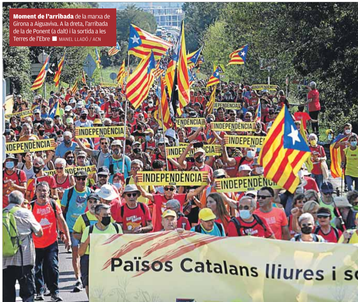
Moment de l'arribada de la marxa de Girona a Aiguaviva. A la dreta, l'arribada de la de Ponent (a dalt) i la sortida a les Terres de l'Ebre