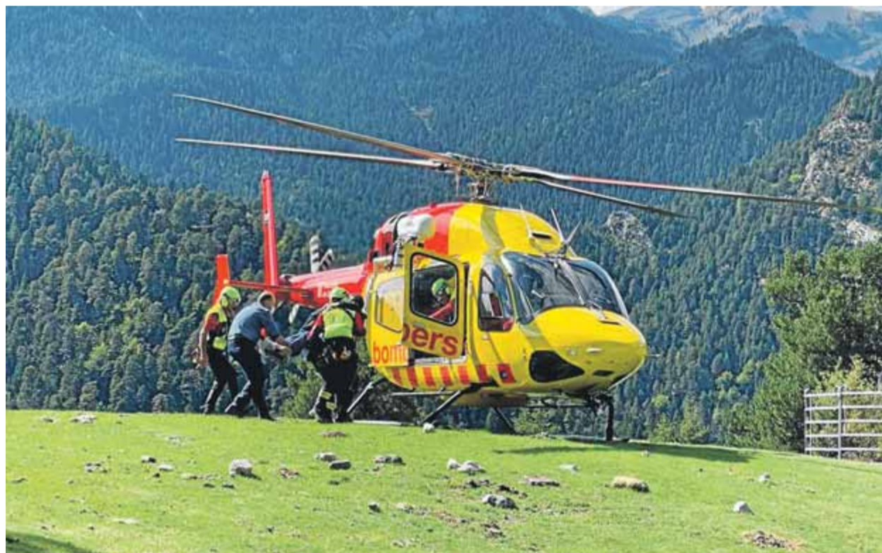
Un dels rescats que els Bombers de la Generalitat han efectuat recentment

Els telèfons mòbils amb accés a internet poden ser de molta utilitat si ens allunyem del grup o hem perdut de vista els punts de referència. Per això és important no sortir de casa sense el telèfon perquè resultarà de gran utilitat per