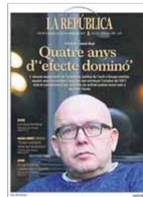
Portada d'aquest dissabte de La República