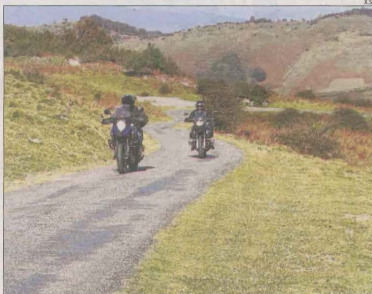
Les motos permeten transitar per vies poc atractives per al cotxe.