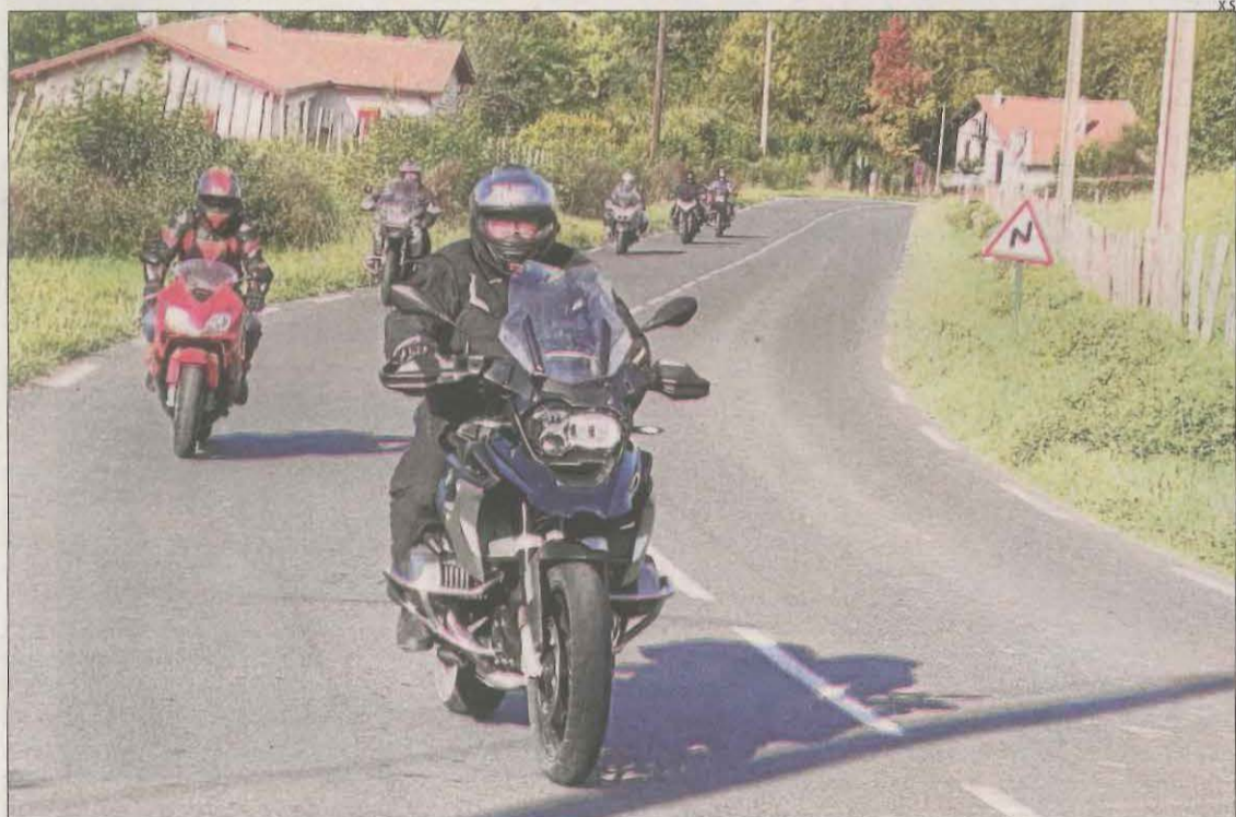
És habitual trobar-se grups nombrosos de 8 o 10 motoristes.