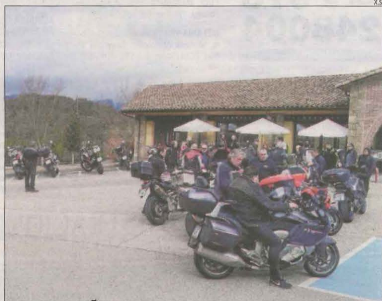
Bars i restaurants són els més beneficiats.