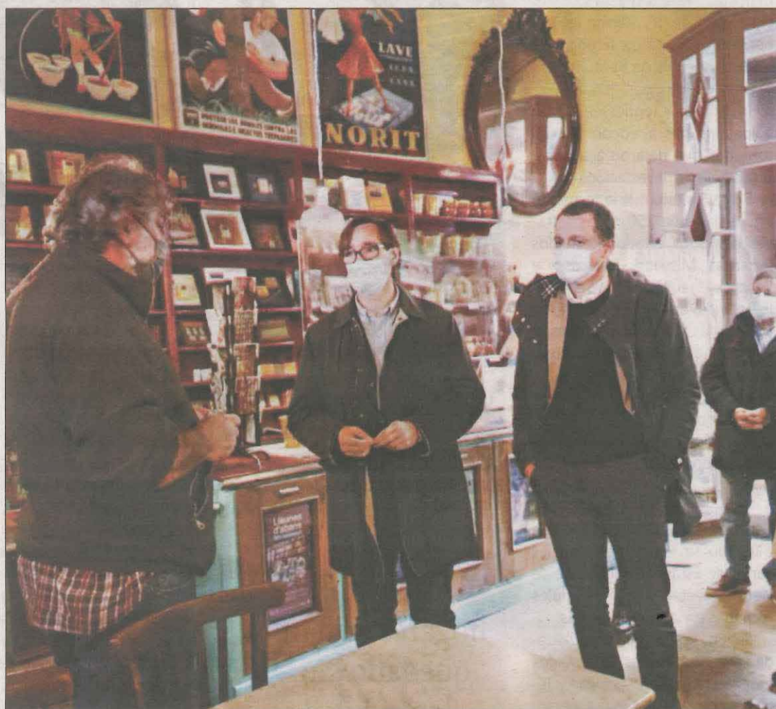
El líder del PSC, Salvador Illa, en una visita ahir a una botiga històrica a Salàs de Pallars

El president del PSC-Units al Parlament, Salvador Illa, va reclamar aquest dissabte “deixar treballar” els professionals de l’educació arran de la polèmica viscuda a Canet de Mar. “Fan un mal servei a Catalunya, a les escoles i a la defensa del català aquells que en polititzen el seu ús”, va apuntar Illa després de visitar l’Hospital del Pallars en el marc d’una visita