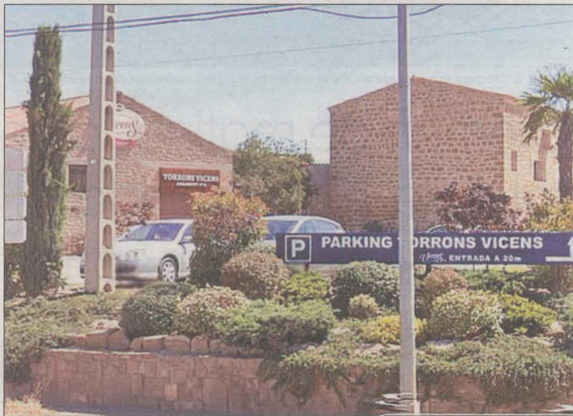
Imatge de la masia de Cal Galzeran d'Agramunt, que serà rehabilitada després de l'aprovació

A la part central, es troben dues edificacions de l'antiga masia de Cal Galzeran. La singularitat d'aquesta ubicació en el context de la trama urbana ve donada perquè actua com a punt de connexió de dues vies, la C-14 i la