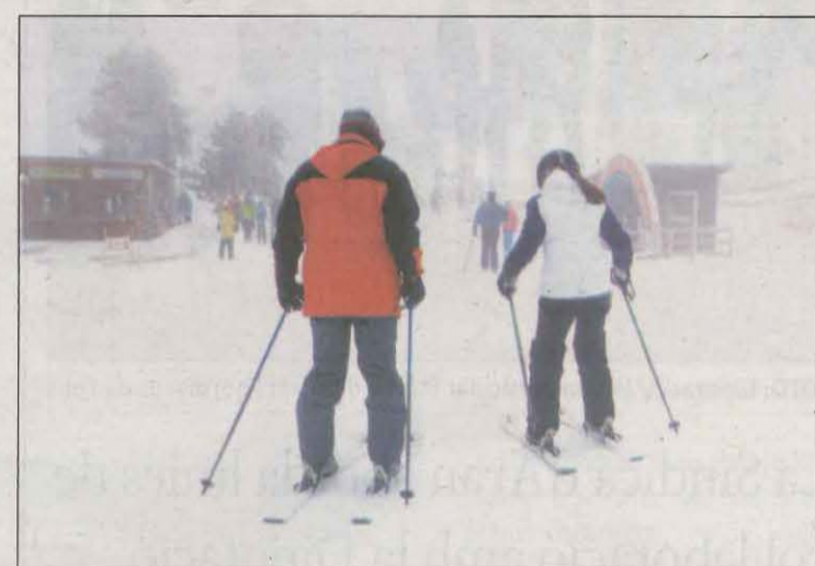
Dos esquiadors a l'estació de Port Ainé

Les sis estacions de muntanya de Ferrocarrils de la Generalitat de Catalunya (FGC) donen la benvinguda al Nadal amb bones previsions. El personal de les explotacions treballa perquè La Molina, Vall de Núria, Vallter, Espot, Port Ainé i Boí Taüll puguin oferir el màxim d'instal·lacions i serveis operatius durant les festes nadalenques després d'un inici de temporada amb gran afluència de públic. Nadal blanc a les dues estacions del Pallars Sobirà. Les persones que visitin Espot gaudiran d'un paisatge amb gruixos de neu pols de fins a 120 cm, podran esquiar o surfear a més del 90% de les pistes i itineraris de l'estació. Una estampa nadalenca que es repetirà a Port Ainé, on els usuaris podran lliscar per més de