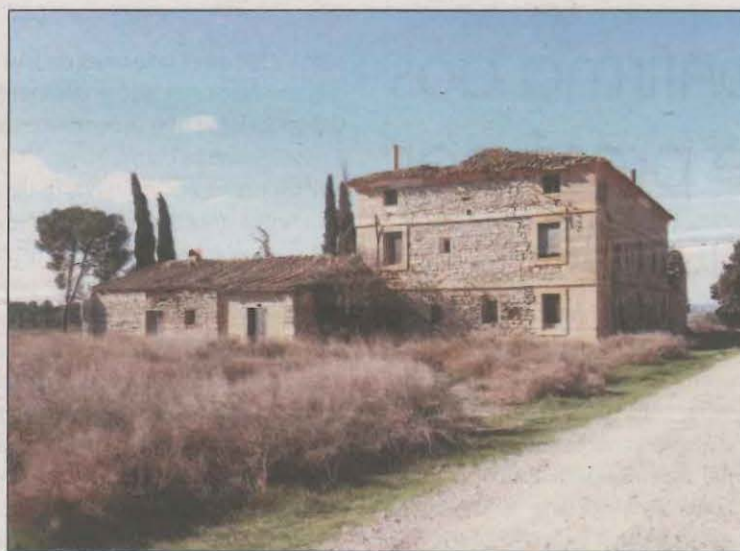
El conveni suposaria l'aportació de 300.000 euros en 2 anys

de l'expresident Francesc Macià i que es troba en mal estat de conservació. Segons va poder saber l'ACN de fonts de la Diputació, la proposta surt de la darrera reunió que hi va haver a tres bandes el 30 de novembre i després de la corporació municipalista i Cultura hagin acordat signar un conveni que en dos anys suposaria l'aportació de 300.000 euros a