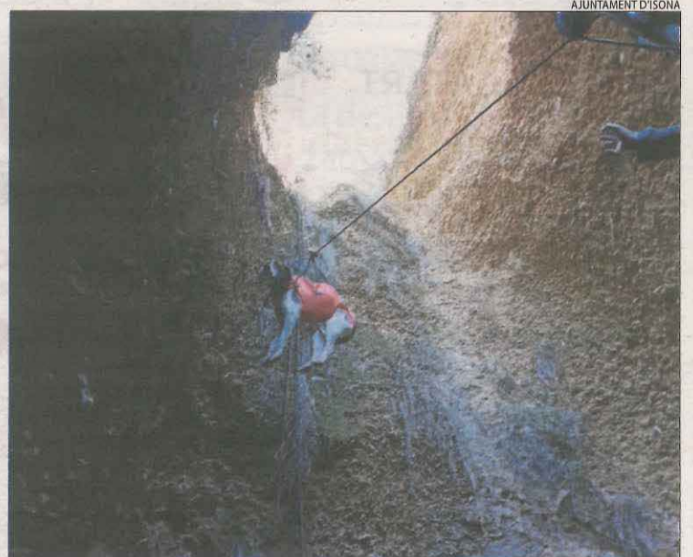
Imatge del rescat del gos.

ISONA | Els Bombers de la Generalitat van rescatar diumenge un gos que va caure per un barranc d'uns catorze metres d'altura a Isona i Conca Dellà. L'ajuntament va informar a través del seu perfil a les xarxes socials d'un rescat que es va produir a la zona de Sant Corneli, a prop de Montesquiú. El gos va ser embolicat en un arnès i amb cordes el van poder extreure de la cavitat. Es trobava en perfecte estat.