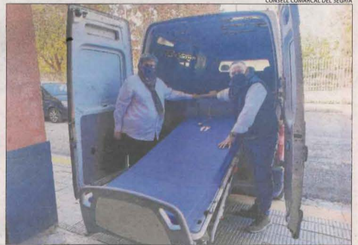
CONSELL COMARCAL DEL SEGRÀ