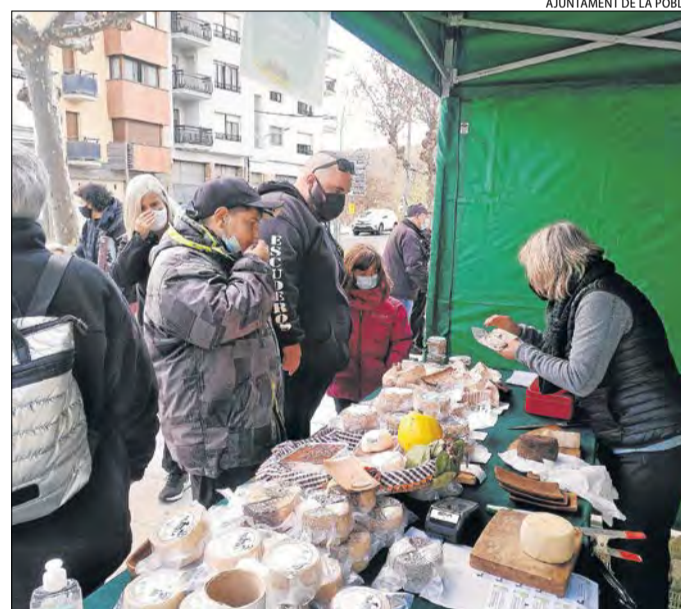
Una de les parades de la Fira de Nadal de la Pobla de Segur.