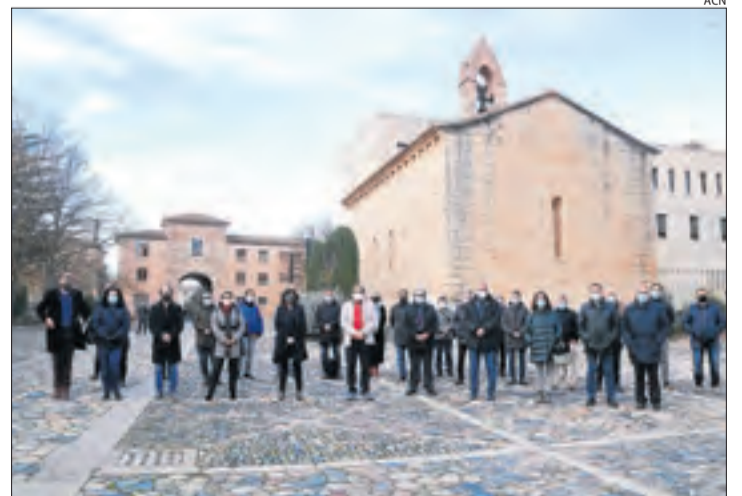
Els representants dels municipis afectats pel parc.