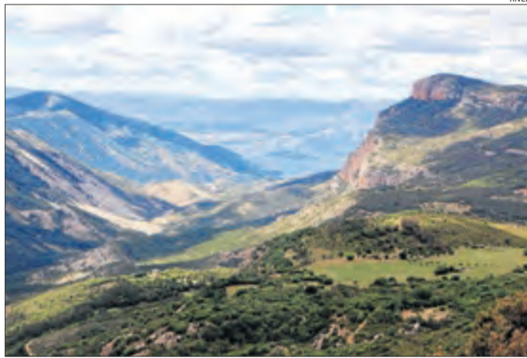
Vista de la vall de Carreu, a la zona sud de la reserva.

La Reserva Nacional de Caça (RNC) de Boumort va ser creada per llei i aprovada pel Parlament de Catalunya l'octubre del 1991 per protegir i aprofitar les espècies animals en estat salvatge que l'habitaven i preservar els ecosistemes. De les 13.000 hectàrees que formen aquest espai protegit, 9.800 són propietat de la Ge-