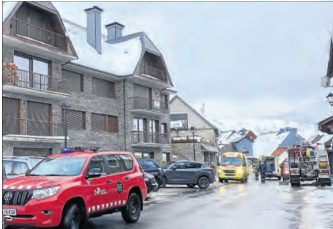
Imatge del dispositiu a primera hora de la tarda d'ahir a Bagergue.

l'intentar contactar-hi sense èxit. Els Bombers Emergències es van desplaçar amb quatre dotacions –una ambulància suport vital avançat, una ambulància bàsica, un camió de salvament i vehicle de comandament– amb un total de dotze efectius. A la seua arribada al número 8 del Camin Pessòla, van localitzar