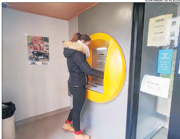
Una veïna de Vilaller utilitzant el caixer automàtic.

pobles petits ens van tancat serveis bàsics?". L'edil va dir que, de moment, desconeixen quan tancaran l'oficina. En una carta (vegeu la pàgina 6), l'alcalde denuncia que es quedaran "sense un servei essencial" i que els veïns hauran de desplaçar-se per carretera en un trajecte d'onze minuts per arribar a l'oficina bancària més pròxima, al Pont de Suert. També afirma que als pobles