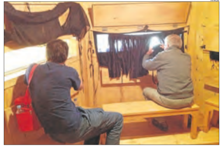
L'interior de l'observatori d'aus.