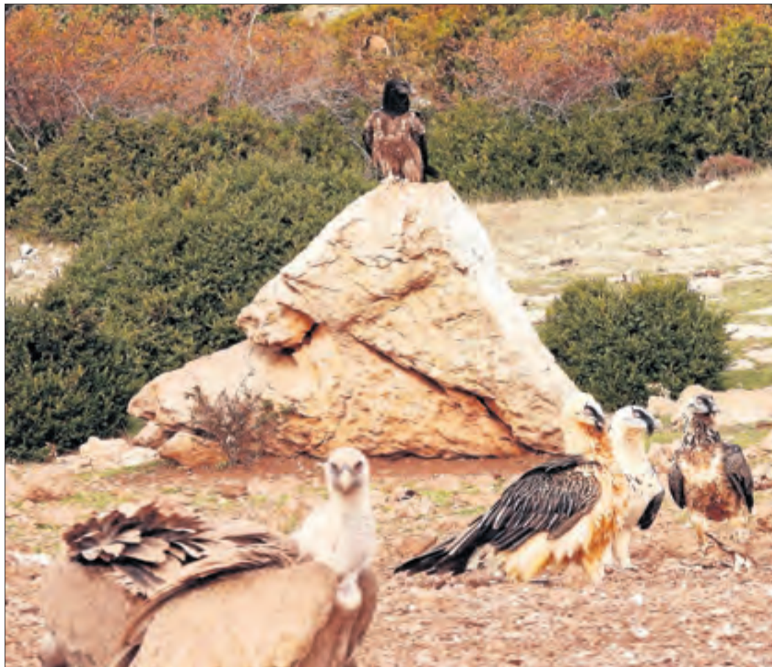
Imatge de diferents exemplars de trençalòs de diferents edats.