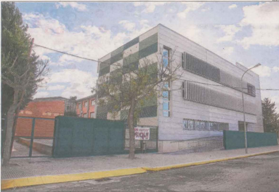
Imatge de l'institut Alfons Costafreda, on es van produir els fets el passat 30 de novembre.