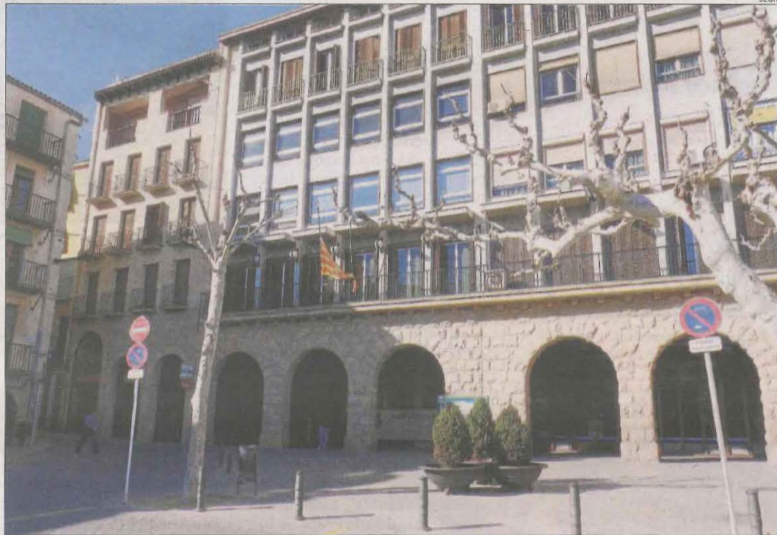
Imatge d'arxiu de la seu de la Paeria de Balaguer.

El novembre passat cap aspirant va superar les proves en les quals havien d'acreditar els coneixements per exercir el càrrec. Dels nou candidats que es van inscriure a l'obrir la convocatòria, només cinc es van presentar al primer examen. Dos d'ells van arribar a la segona prova i cap la va superar. Ara