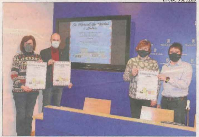
Presentació ahir del Mercat de Nadal d'Almenar.