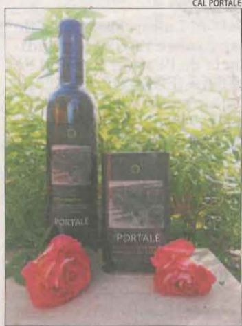
L'oli de Cal Portalé.