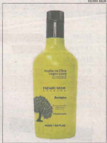
Un dels olis d'Henri Mor.

Els olis d'aquesta empresa van ser guardonats amb la Medalla d'Or a la New York International Olive Oil Competition, el concurs més prestigiós quant a la qualitat de l'oli d'oliva, i el Reserva Privada està en la llista dels 100 millors olis d'oliva verges extra del món segons la guia Evooleum Top 100 i compta amb distribució als Estats Units, Equador, Panamà, Veneçuela i Rússia, a part d'Espanya.