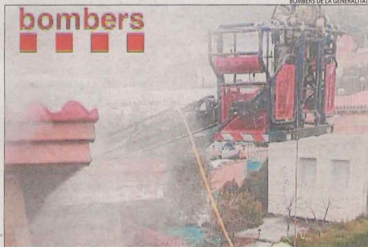
Un bomber treballant ahir a l'incendi a Alpicat.