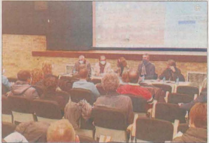
La reunió feta ahir amb alcaldes del pla de Lleida.