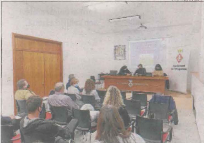
Imatge de la reunió que es va fer ahir a Torregrossa.