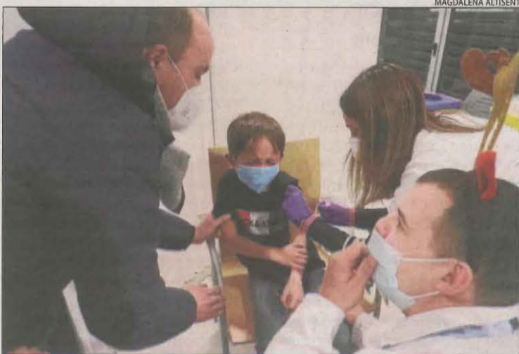
La por de la punxada va afectar nombrosos nens.

La vacunació infantil també va començar ahir amb bona acollida a la resta de l'Estat. A Catalunya, s'han demanat més de 82.000 cites. Els més petits són els que lideren la incidència de contagis des de fa dos mesos.