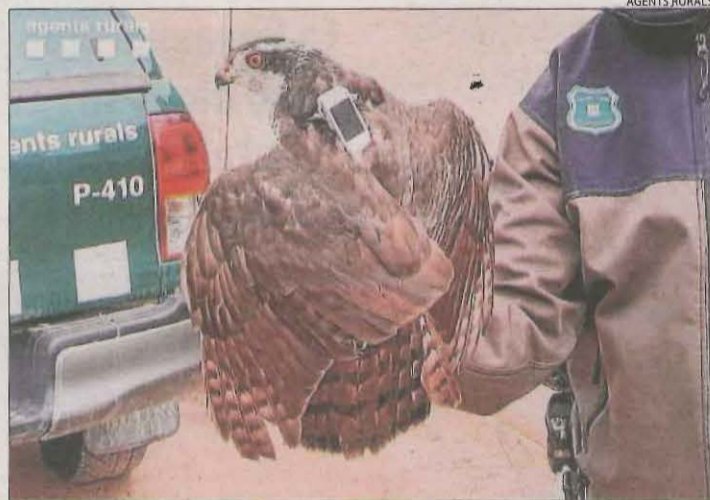
L'astor forma part d'un estudi de seguiment de la UB.