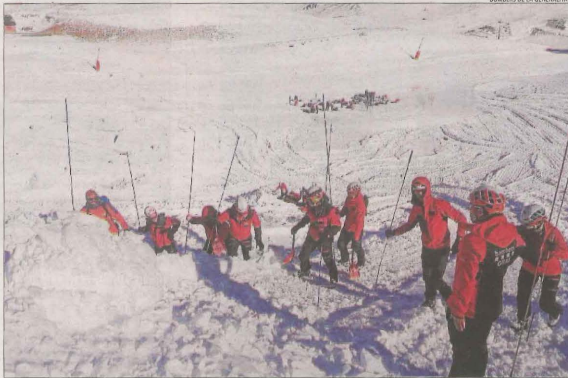
Simulacre de rescat per una allau amb múltiples víctimes aquesta setmana a l'estació de Boí Taüll.

La majoria de les sortides al medi natural van ser per accidents de muntanya, amb 260 rescats, seguides d'auxilis de persones perdudes o desorientades, amb 83 sortides, i 29 actuacions més per assistències en medi fluvial com rius o barancans. També hi va haver dos rescats per auxiliis en coves. Per comarques, la Val d'Aran és la que concentra aquest any el nombre més elevat de rescats en muntanya, amb 89 sortides fins al 13 de desembre. La segueixen el Pallars Sobirà, amb 74 rescats; l'Alta Ribagorça, amb 46; l'Alt Urgell, amb 43, i la Noguera, amb 38. Per la seua banda, el Pla d'Urgell, amb un rescat, i