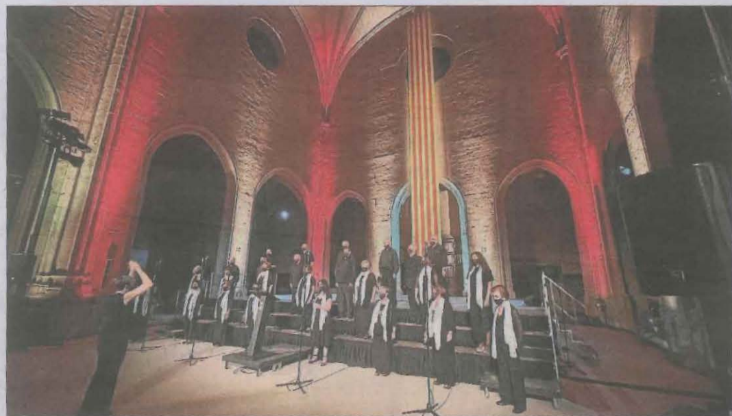
L'Orfeó Balaguerí preveu actuar el pròxim dia 26.

ORFEONS I ORGUES ES PRODIGUEN ARREU DEL TERRITORI