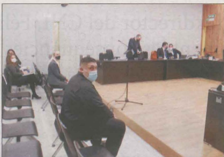
L'acusat en l'inici del judici el passat octubre

vestigació, va explicar el passat octubre que, segons les proves, l'acusat va xocar per encaix amb el cotxe que tenia davant, conduït per l'acusada, en voler-la avançar, i després va envair el carril con-