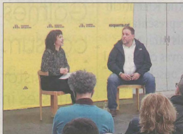
En un acte a Tàrrrega, amb la participació de l'alcalde