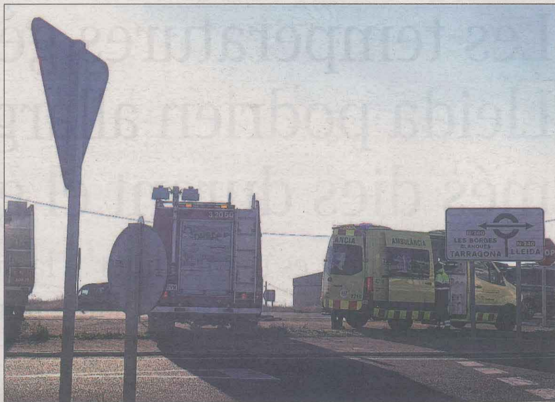
Les dotacions dels Bombers de la Generalitat i l'ambulància del SEM a la carretera N-240

Una crema de poda controlada que no estava del tot apagada va causar un foc dissabte a les 22.25 hores a Almacelles. Una dotació del cos de Bombers es va desplaçar al lloc dels fets per acabar d'apagar el foc. D'altra banda, ahir a la tarda, també van apagar un altre petit foc de vegetació agrícola a Alguarrie, a les rodalies de l'aeroport.