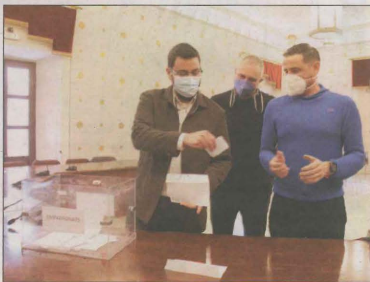
L'alcalde fent el recompte de la consulta popular

representants dels àmbits de la recerca, la tecnologia, la indústria, els cossos de prevenció i extinció d'incendis, els propietaris forestals privats, les universitats i els centres tecnològics d'àmbit públic i privat amb el propòsit de generar una gran xarxa de ciència i de gestió de desastres naturals. Acollirà el projecte durant tres dies.