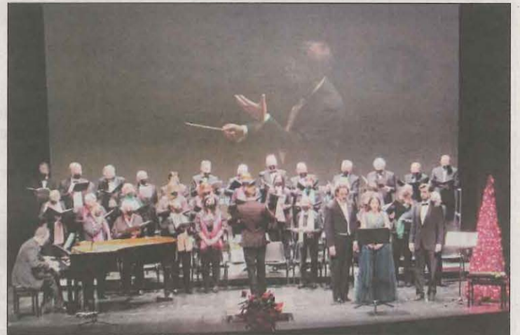
La Polifònica de l'Urgell i la Coral Sant Sadurní