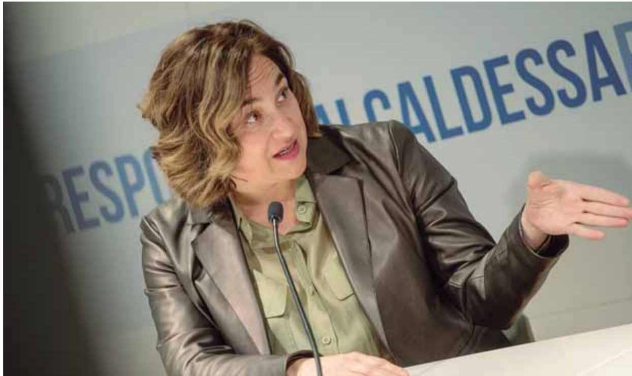
Ada Colau, durant la seva intervenció d'ahir en l'acte del Col·legi de Periodistes

Amb relació a la querrella en concret, Colau va dir: "Em refermo encara més en el fet que no hi ha cas. El jutge farà el que cregui que ha de fer, però em reafirmo en el fet que el cas no tindrà cap recorregut." L'alcaldessa va lamentar aquesta estratè-