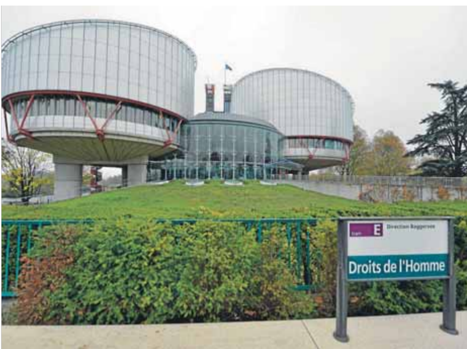
Seu del Tribunal Europeu de Drets Humans (TEDH) a Estrasburg, Alsàcia