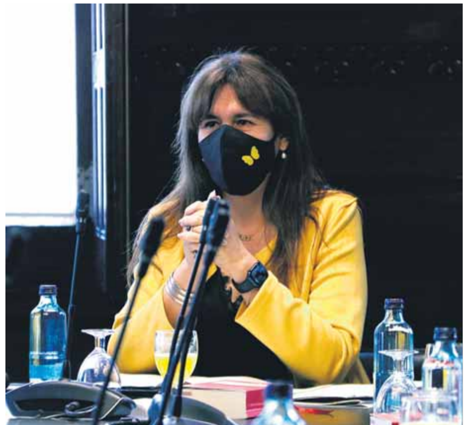
La presidenta del Parlament, Laura Borràs, dilluns