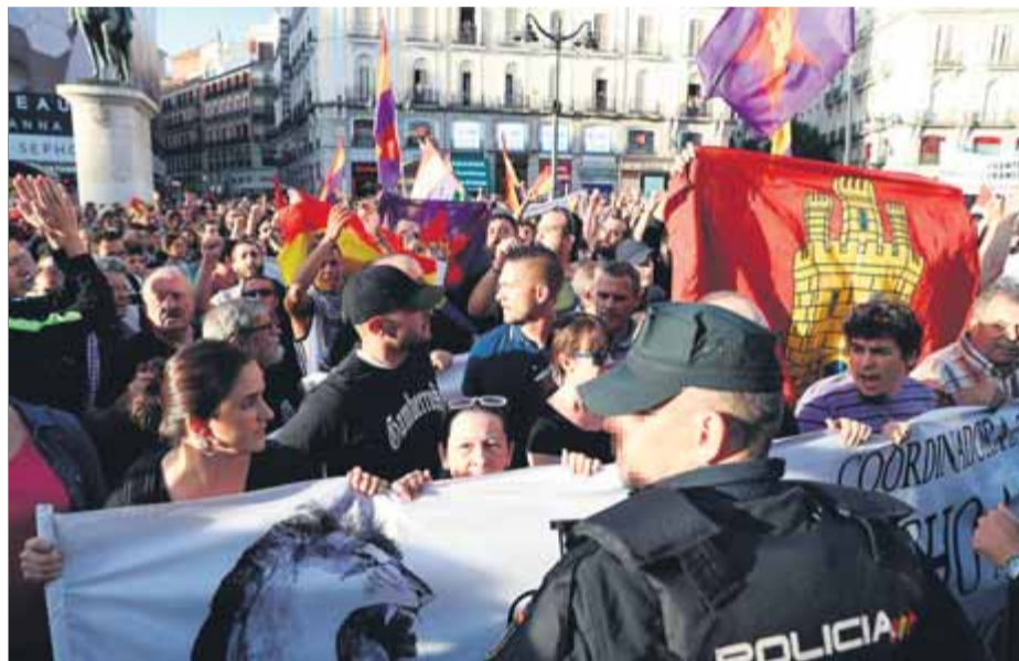
Un instant de la concentració que va tenir lloc la tarda de l'1 d'octubre del 2017 a la plaça del Sol de Madrid, sis participants de la qual van acabar processats i dos, amb condemna

Aquell dia no hi va haver cap detenció ni cap incident que es comunicés, i al cap d'uns mesos sis manifestants van ser detinguts, de matinada, a casa seva, acusats de lesions i desordres públics. L'acusació era dels ultres que tenien com a advocat el mateix que va defensar