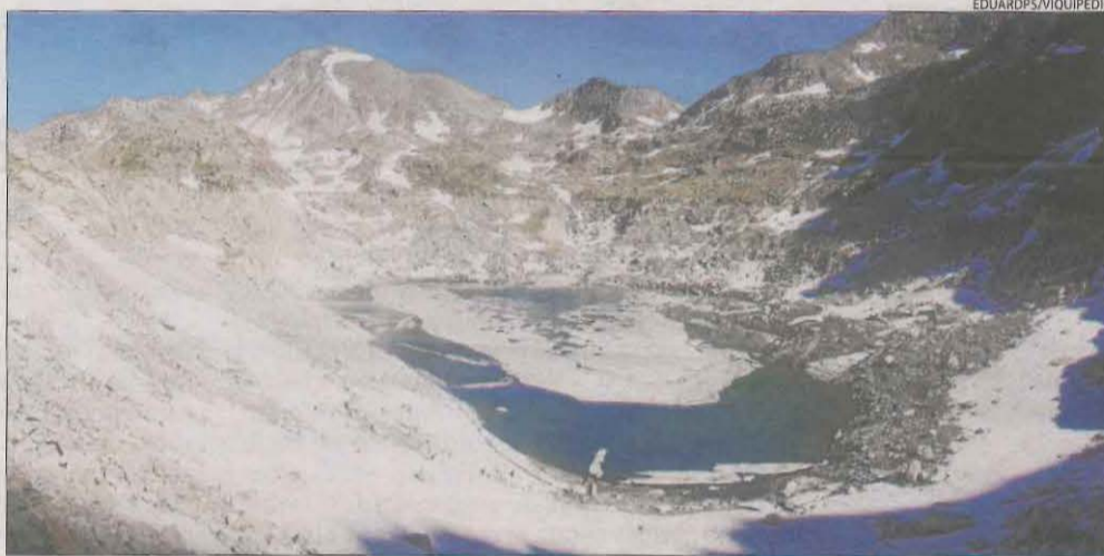
El llac de Saburó, a la foto, tot just manté una mica d'aigua en el fons.

Dos solucions || Endesa planteja reparar-la i la CHE retirar canonades i que torni al seu estat natural