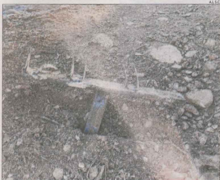
La trampa que els ciclistes van trobar ahir al sender.

■ Endesa va apuntar que, a l'elaborar el seu projecte el 2019, va buscar consens amb la Torre de Capdella, la CHE, el Parc Nacional i els Agents Rurals.