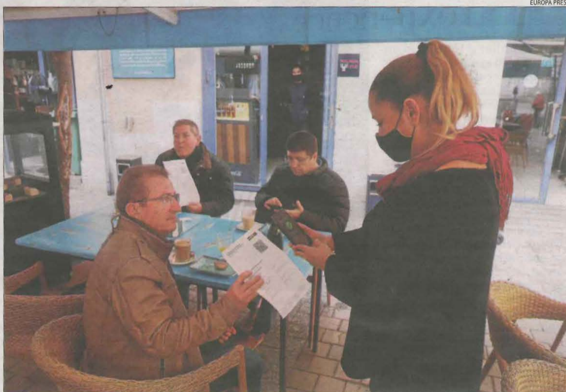
Una cambrera comprova el passaport Covid d'uns clients.

Centrant-nos en Lleida, durant l'any passat es van rubricar a la província un total de 169.594 contractes, i d'aquests, 20.948 van ser de caràcter indefinit, la qual cosa representa un ascens del 32,56 per cent