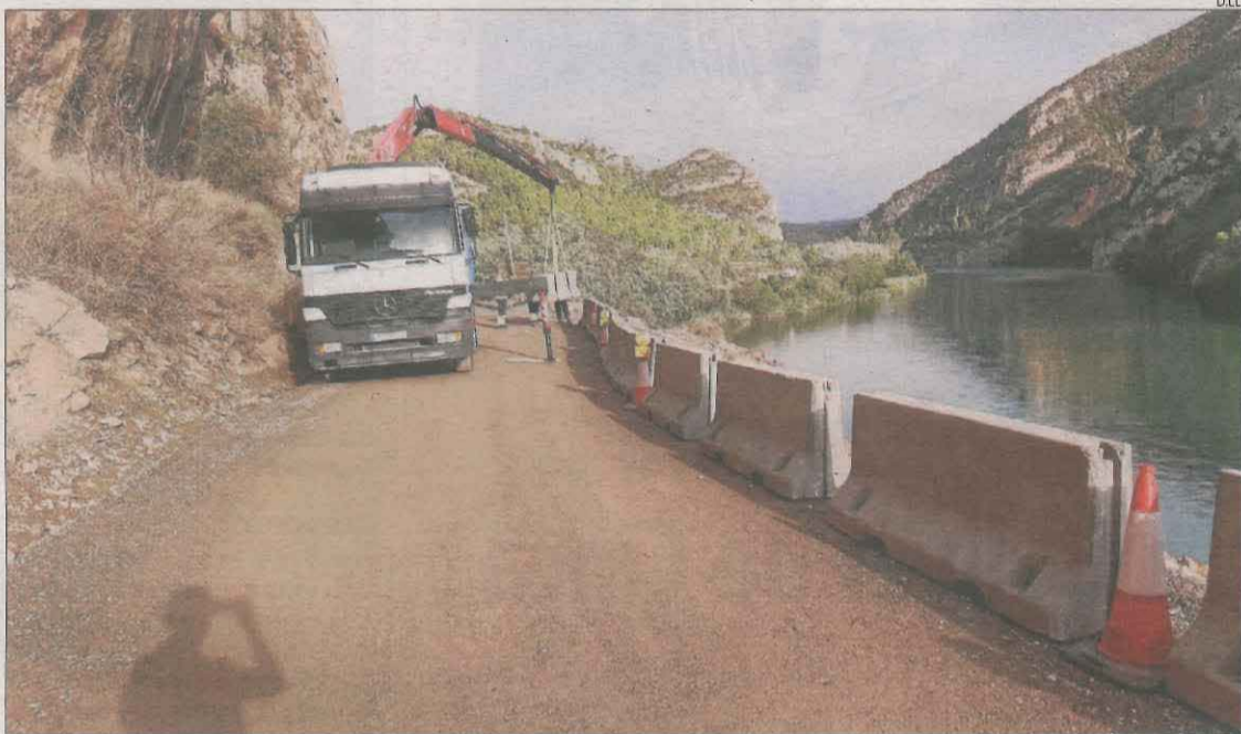
El mur de contenció perquè la via tingui doble sentit es farà al marge al costat de l'embassament.

Les obres començaran tan aviat com Telefónica retiri pals i garanteixi la cobertura a la zona || Per recuperar el doble sentit en un tram de dos quilòmetres