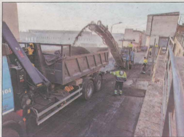
Imatge de les obres al carrer Divina Pastora

L'Ajuntament de Balaguer va iniciar ahir al matí les obres de millora del paviment del carrer Divina Pastora que es trobava molt deteriorat en el tram proper al taller l'Estel. Aquesta actuació iniciada ahir es troba dins les tasques de manteniment vial que la Paeria durà a terme aquest 2022 en diferents carrers de la ciutat. També s'actua en l'accés al parc de la Transsegre.