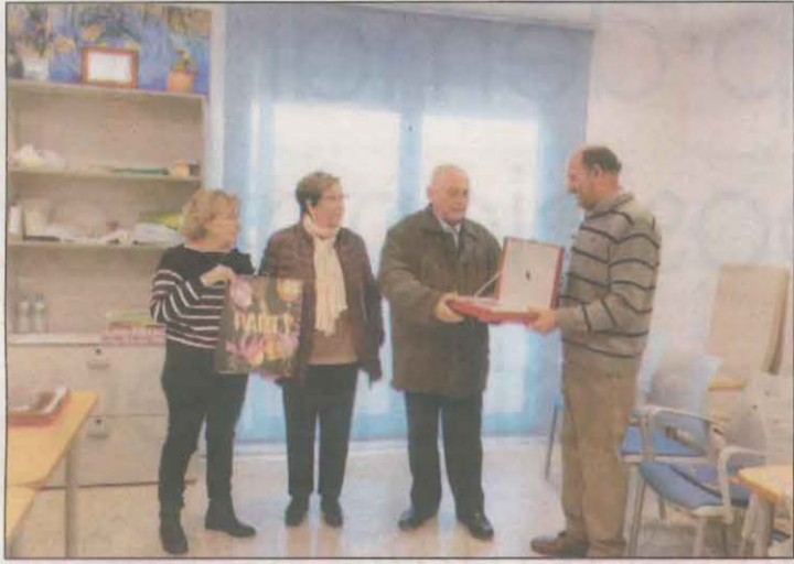
Moment de l'entrega de la placa commemorativa