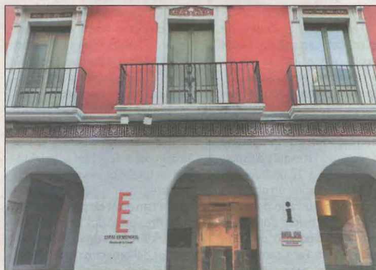
Imatge d'arxiu de la façana de l'Espai Ermengol

Pel que fa a les diferents activitats que ha ofert durant el 2021 en destaca la bona acceptació dels cicles de conferències Parlem d'Història i Desenterrant el Passat, que a partir de la pandèmia ha quedat consolidat el sistema híbrid d'assistència: de manera presencial, a la sala sant Domènec, i de manera online a través del canal de YouTube. Pel que fa a la tradicional 'Ruta del formatge', s'ha reemprem amb la col·laboració d'agències de viatges que han aportat un públic d'altres països. Durant el 2021 l'Espai ha continuat amb el projecte 'El museu és una escola'.