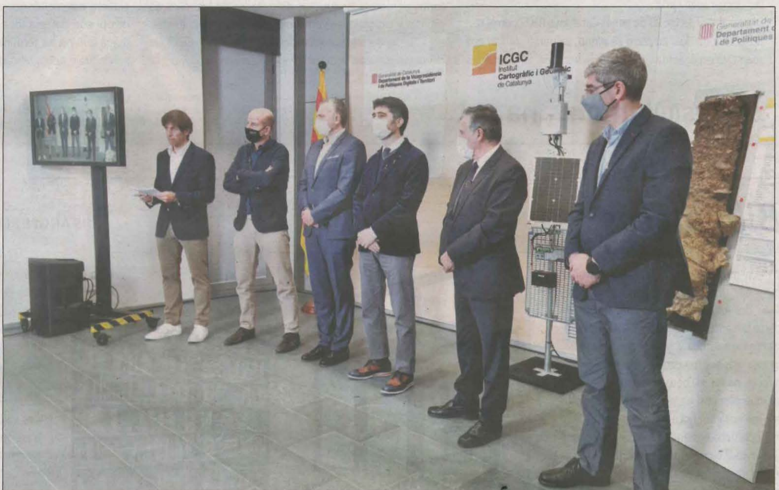
L'acte que es va fer ahir a Tremp amb el vicepresident Jordi Puigneró

A partir d'aquí, el projecte va començar a la Conca de Tremp en terrenys de cultiu de vinya i s'ha