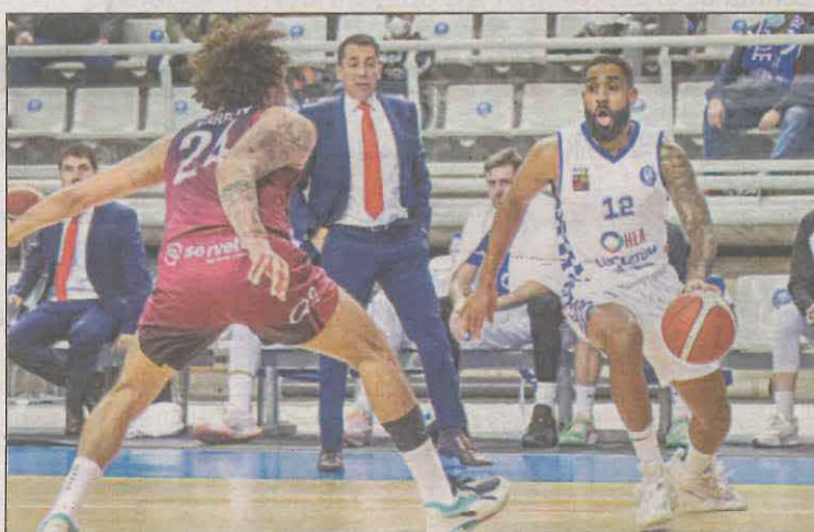
El equipo sufrió la cuarta derrota de la liga

El equipo leridano dispuso al final de un triple ganador, pero Rosa, que jugó un buen partido, no acertó. El técnico, Gerard Encuentra, dijo que se iba "con la sensación de que el partido lo hemos perdido nosotros por detalles". | PÁG. 26