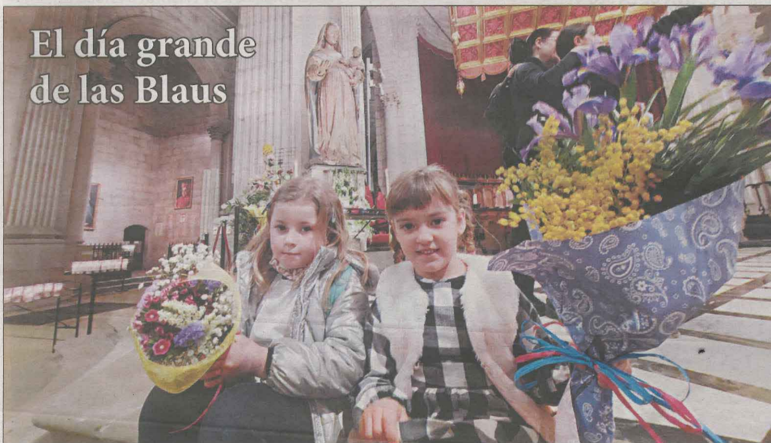
Las familias celebraron ayer en la Catedral la tradicional fiesta de esta Virgen | P. 12