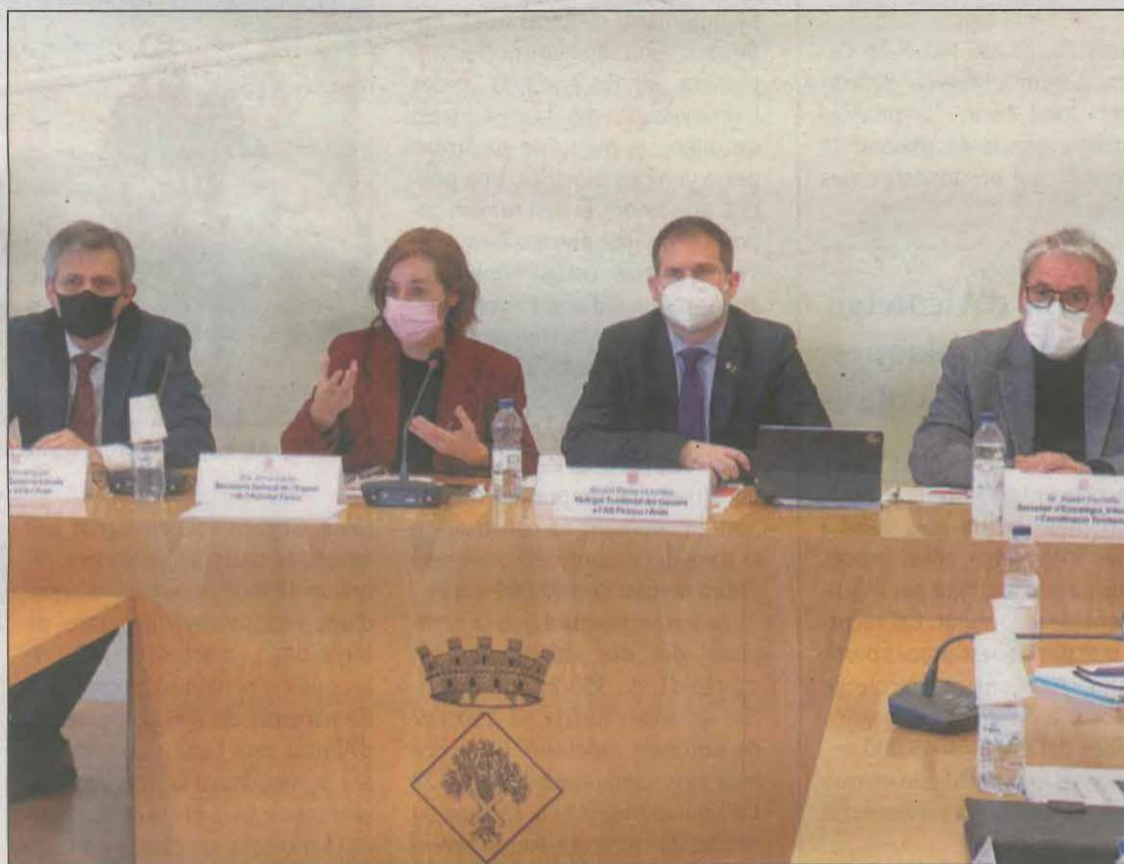
El consell d'alcaldes de l'Alt Urgell d'ahir, on es van abordar els Jocs Olímpics d'Hivern