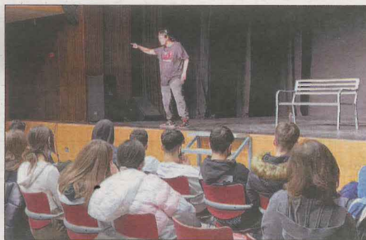
L'actriu i activista feminista Pamela Palenciano

car que, per tal de donar resposta a aquest problema, s'ha doblat enguany el pressupost inicial destinat a l'allotjament de dones en situació de violència i els seus fills, amb un total de 35.000 euros. "Estem duent a terme accions de prevenció d'assetjament sexual i de foment de la igualtat als instituts dins el Pla de salut i educació comarcal", així com la representació del món teatral de l'actriu i activista feminista Pamela Palenciano ahir a l'INS d'Alpicat, "perquè és important treballar aquests temes des d'edats joves", va indicar Bosch.