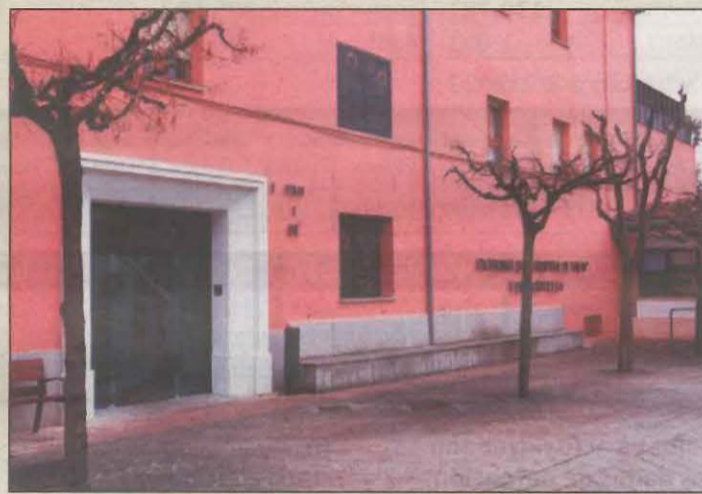
Exterior de la Residència Filella de Tremp

La setmana passada fiscalia de Lleida va presentar la denúncia contra les dos treballadores de la residència Fiella de Tremp i aquest dimecres el jutjat de la capital del Pallars Jussà ja va obrir dues causes contra elles. Als autors de les causes hi figura que