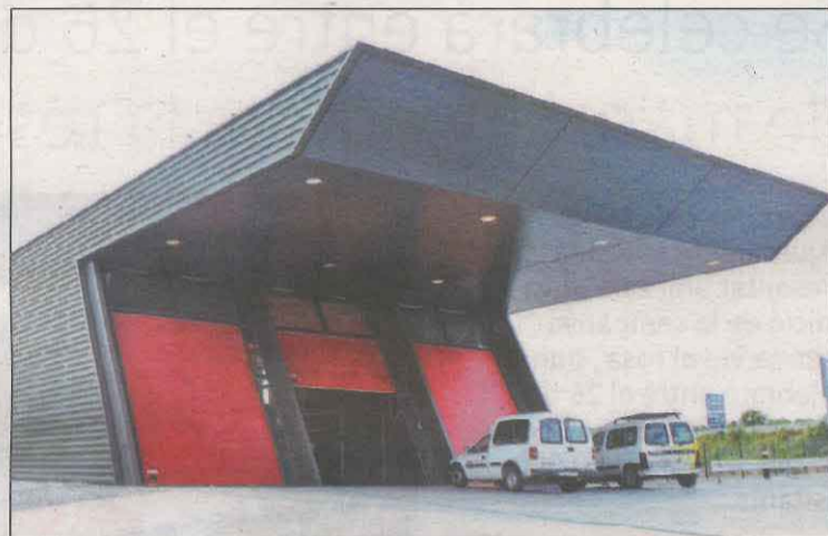
L'edifici del Parc de Bombers de les Borges Blanques

Des de Bombers per les Garrigues asseguren que no es pot mantenir al marge davant "les