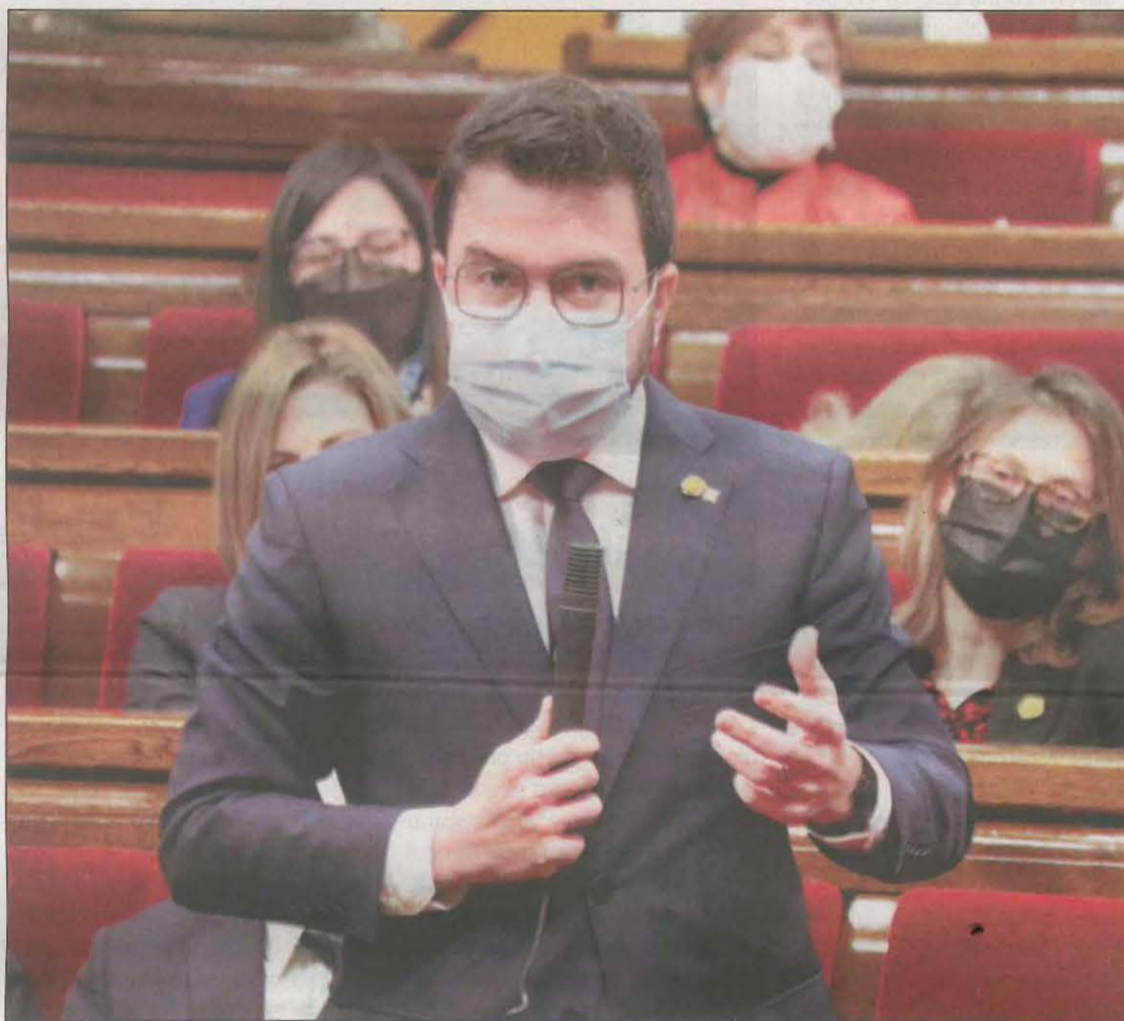
El president de la Generalitat, Pere Aragonès, ahir en la sessió de control al ple del Parlament

El cap de l'Executiu català va deixar clar el seu convenciment que Catalunya té "tots els actius per liderar una proposta forta" per als Jocs, si bé ha insistit a mostrar-se "obert a tot" i que "altres territoris hi puguin participar", però va recalcar que "sempre defensaré, com a president de Catalunya, que Catalunya reuneix totes les característiques perquè se celebrin la majoria de proves". A la seva rèplica, Illa va indicar que Catalunya "no pot deixar escapar" la possibilitat de celebrar els Jocs i, en aquest sentit, ha ofert "tot el suport" del grup socialista per "treballar junts i fer possible" la celebració de els Jocs. "No perdem de vista que fer-ho amb Aragó suma i ajuda. Celebro que vostè ho vegi de la mateixa manera", va apuntar el líder del PSC-Units, que va istar el Govern a "mirar cap endavant, deixar de fixar la vista a el retrovisor i de veure problemes on no n'hi ha". Les crítiques a la candidatura catalana han arri-