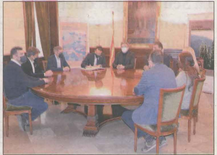
Una delegació de la Diputació de Badajoz

De moment encara no se sap quan se celebrarà el ple però aquest regidor buscarà suports i complicitats d'altres grups per tirar-la endavant amb l'objectiu que es posi "més atenció en el territori" i que es millori la situació per "modernitzar l'hospital".