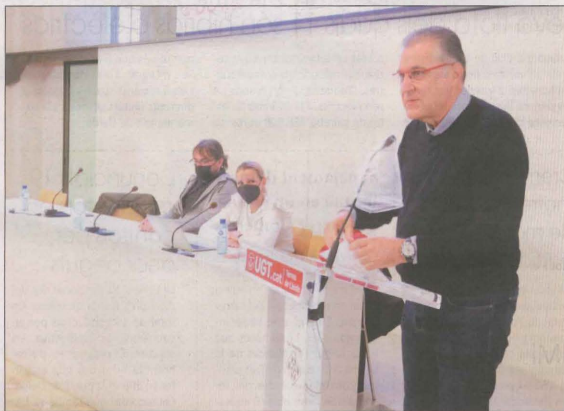
El sindicat UGT sosté que els Jocs poden ser una "bona experiència"