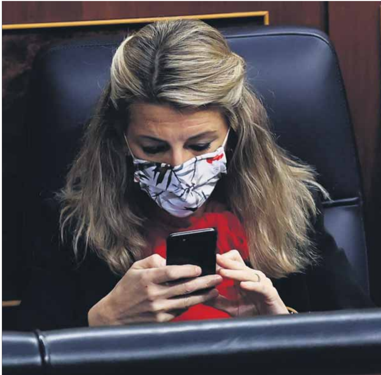
La vicepresidenta Yolanda Díaz no digereix haver de salvar la reforma laboral amb Cs i la dreta sense ERC

La reforma laboral viu la particularitat d'estar ja en vigor des de l'1 de gener –amb els efectes sobre el fre a la temporalitat en curs– però necessita avui la convalidació al Congrés amb més sí que nos o bé