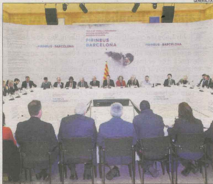
Imatge d'arxiu d'una de les reunions de la candidatura.

Davant de la necessitat de ser "al més discret possible", com li va demanar el president del COE, Lambán va subratllar que ja "arribarà el moment de tornar a parlar dels aspectes institucionals" i va anunciar que llavors Aragó "tornarà a la càrrega amb els mateixos arguments del primer dia".