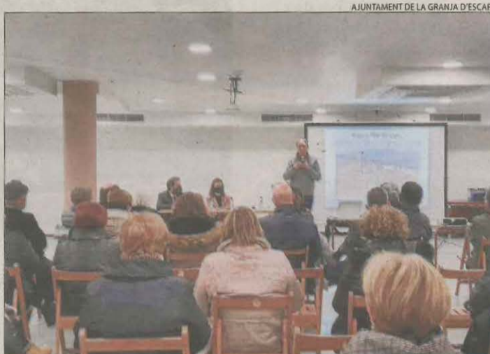
Reunió a la Granja contra la línia de Forestalia a la localitat.

■ De 400 kV i procedent d'Osca, travessa a Lleida els municipis de la Granja d'Escarp, Seròs, Maials, Llardecans, Torrebesses, la Granadella, Granyena de les Garrigues, el Soleràs, els Torms, Juncosa, la Pobla de Cérvols, el Vilosell, Vinaixa i Tarrés. Des d'allà seguiria fins a Hostalets de Pierola (Barcelona).