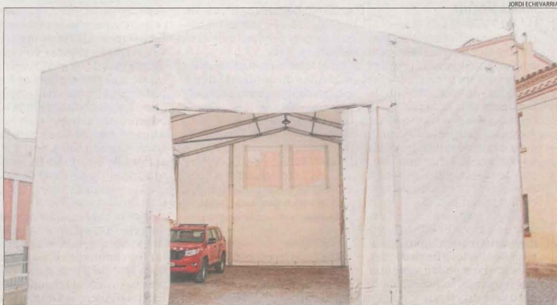
Carpa per als vehicles dels Bombers de Seròs, que van deixar el parc per risc d'ensorrament.

■ L'exdirectora de la residència de Tremp va declinar ahir valorar l'acusació de la Fiscalia a preguntes d'aquest diari. Per la seua part, la Fundació Fiella va emetre un comunicat en el qual va assegurar que ha col·laborat i col·laborarà perquè s'aclareixin els fets que han motivat l'acusació. "Creiem en la innocència de les persones que han treballat pel bé dels ancians de la residència", va afegir la Fundació, que va assenyalar que confia "plenament en la Justícia i caldrà esperar els resultats de la seua actuació". El desembre de l'any passat el departament de Drets Socials va informar de la inhabilitació de la Fundació Fiella de Tremp per gestionar la residència d'ancians per un període de quatre anys. La residència va ser intervinguda pel Govern el novembre del 2020. Actualment, la gestió està en mans de Sant Joan de Déu. Inspecció de Treball va multar la fundació amb 30.000 euros per irregularitats laborals.