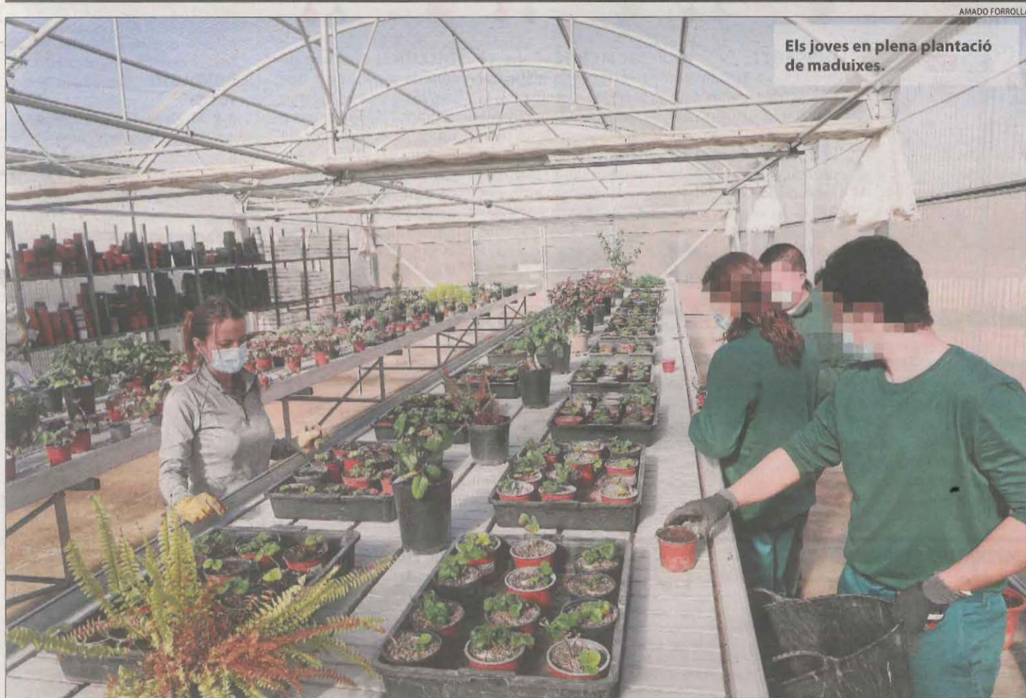
AMADO FORROLLA Els joves en plena plantació de maduixes.