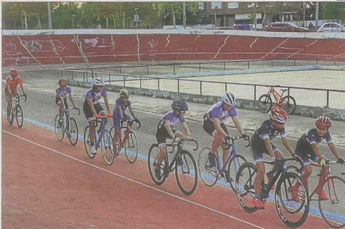
Imatge d'arxiu de ciclistes entrenant-se al velòdrom l'any passat.

Una vegada resolt aquest punt tan sols falta la firma entre el gimnàs Ekke i el Club Ciclista Terres de Lleida –és a dir, es torna al punt de partida de fa uns mesos– abans que s'iniciï el