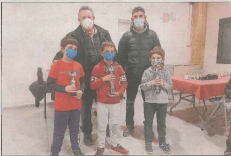
A la foto, els integrants del podi sub-10.