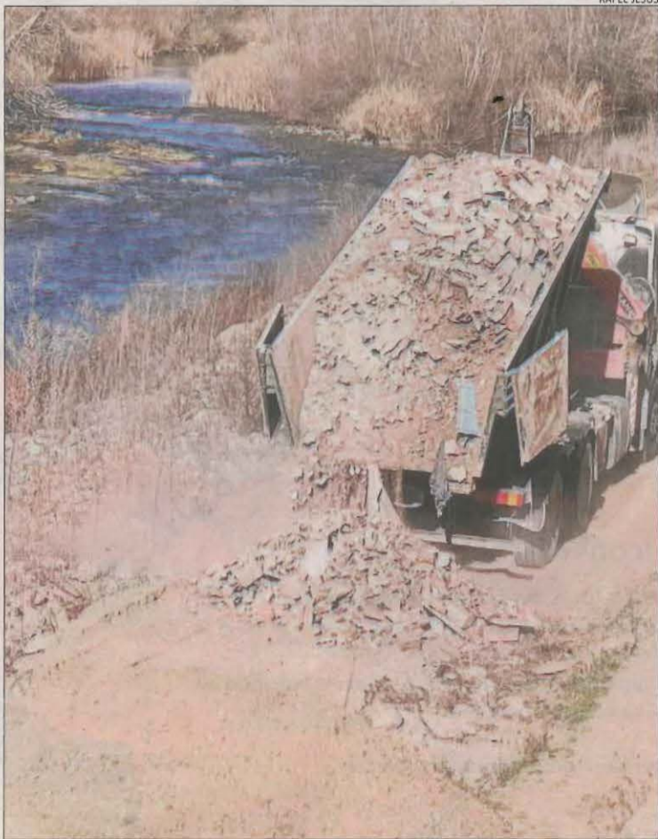
El camió abocant la runa d'obra per anivellar el camí.