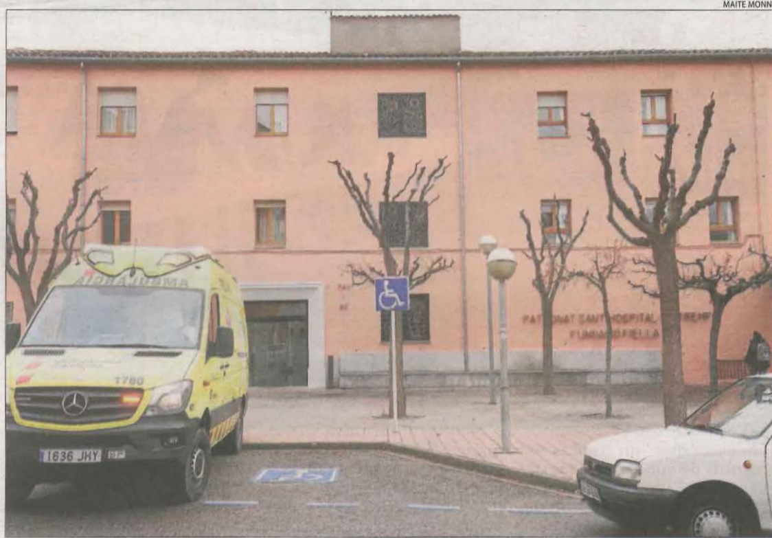
Imatge d'arxiu de la residència Fiella de Tremp, intervinguda per la Generalitat després del brot.

El Ministeri Fiscal va assenyalar ahir que aquestes disfuncions consistien presumptament en l'incompliment del pla de contingència, la falta de previsió, control i supervisió de la direcció i la no-assumpció