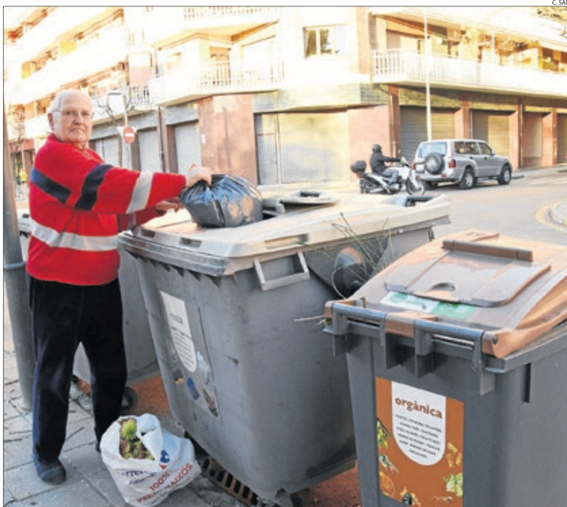
Un veí de la Seu, tirant les escombraries en un dels contenidors de fracció resta que se substituiran.

Els veïns que s'hi inscriuin podran descarregar als seus mòbils una app per identificar-se a l'utilitzar els nous contenidors. També hi haurà targetes per a persones que no utilitzen smartphones. Entraran en servei l'1 de maig, quan s'estrenaran els primers contenidors intel·ligents a la Seu. A partir d'aleshores, se substituiran de forma gradual els d'escombraries orgàniques i fracció resta.