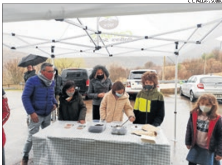
Un dels tallers infantils que es van dur a terme ahir.

Sort | Una vintena de persones van participar ahir en el taller organitzat pel consell del Sobirà per promocionar el compostatge comunitari de la matèria orgànica als pobles. L'objectiu és promoure més el servei dels compostadors (més de 100 en 60 pobles de la comarca) i reduir el volum de les escombraries que van directes a l'abocador.