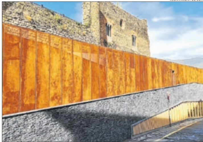
Les obres de l'exterior de la biblioteca ja estan acabades.

Pel que fa a la biblioteca pública, l'alcalde, Baldo Farré, va explicar que durant les properes setmanes s'iniciarà la segona fase de les obres, amb l'objectiu que estiguin acabades a finals d'any i l'equipa-