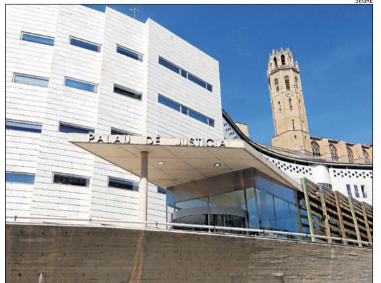
Vista de la seu de l'Audiència de Lleida al Canyeret.

LLLEIDA | L'Audiència de Lleida ha condemnat a sis mesos de presó un lleidatà per estafar prop de 1.000 euros a un company de feina en dos dies a l'utilitzar la seua targeta de crèdit sense consentiment per pagar jocs online. La sentència confirma la pena imposada en primera instància pel Jutjat Penal 2 de Lleida per un delictes d'estafa amb l'atenuant de dilacions indegudes, ja que els fets van tenir lloc l'agost de l'any 2018. Segons la sentència, l'acusat "amb la intenció d'obtenir un il·lícit benefici" i sense autorització del legítim propietari, va fer dos pagaments en una pàgina web de jocs amb la targeta de crèdit d'un company de feina per un import de 998 euros. La víctima va relatar que l'acusat havia fet una fotografia de la seua targeta, per la qual cosa disposava dels danys, ja que a més de tenir una relació laboral també la tenien familiar al ser parella d'una familiar seua. Així mateix, els Mossos van poder relacionar els pagaments a la IP del domicili de la parella de l'acusat i amb el mòbil d'aquest. L'Audiència també descarta la pretensió de la defensa, que atribuïa falta de diligència al web per no comprovar la identitat del propietari de la targeta de crèdit.