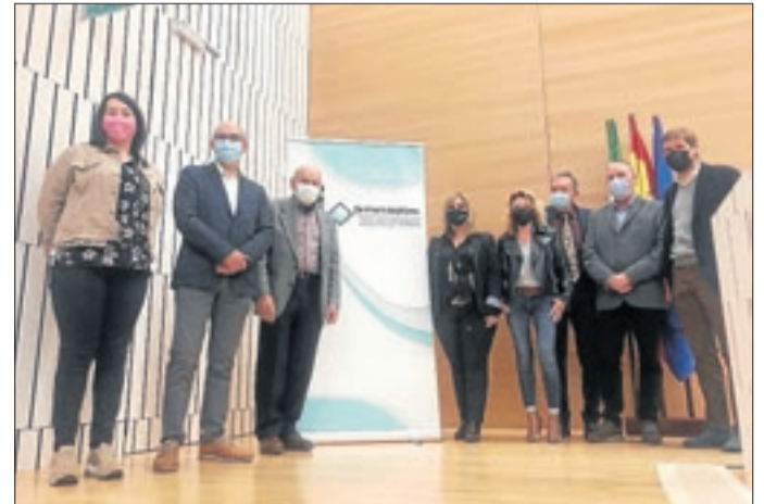
Representants de Lleida i Osca a la comissió de Còrdova.