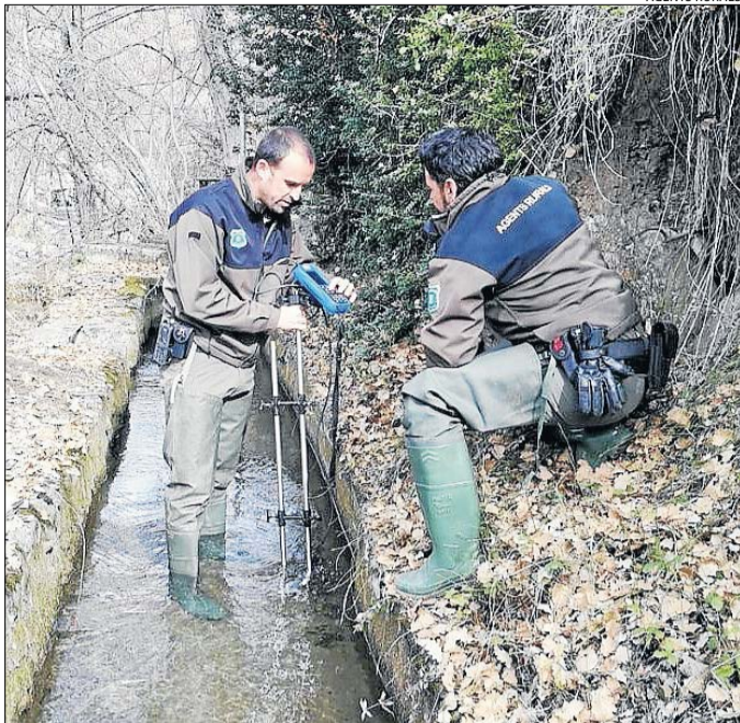
Un dels mesuraments que s'ha dut a terme aquests dies.