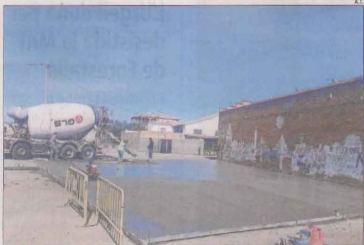
Les obres van començar ahir amb l'aplicació del formigonat.