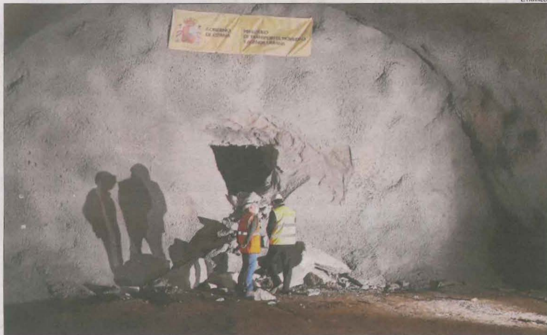
La perforació dels dos extrems del túnel, a la boca est, el març de l'any passat.

Per la seua part, Andreu va apuntar que el revestiment de les galeries haurà d'estar a punt abans de l'estiu i després s'abondarà la pavimentació. A més, va destacar que les obres d'aquest tram de l'A-27 estaran acabades