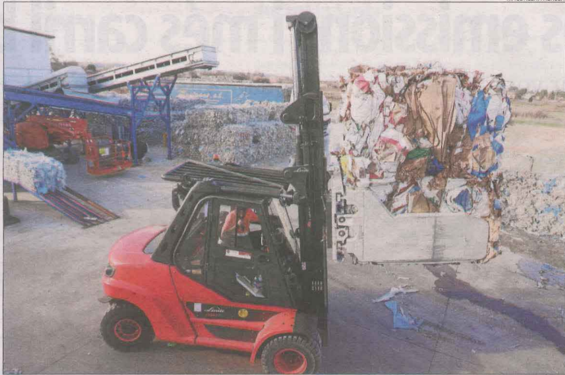
Alier ha invertit 3 milions d'euros de fons UE Next Generation en un sistema d'estalvi d'aigua.

Alier ha entrat també en el reciclatge de plàstic i està re-