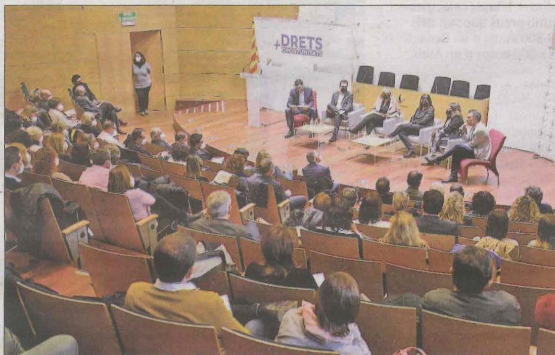
Representats polítics en l'acte 'Més drets, més oportunitats' al campus de Cappont de la UdL

La consellera de Drets Socials, Violant Cervera, va encapçalar l'acte, en què va ressaltar que aquesta àrea serà una de les que més diners rebrà dels fons europeus amb 1.037 milions d'euros, que permetran accelerar la trans-