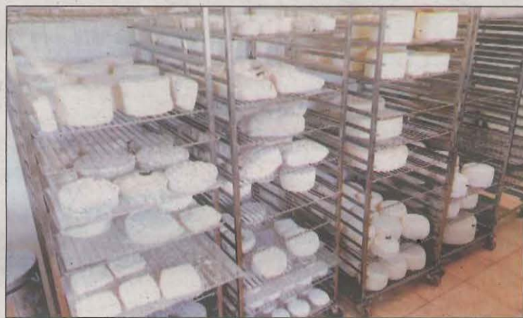
Els formatges elaborats a la Formatgeria de Pallars