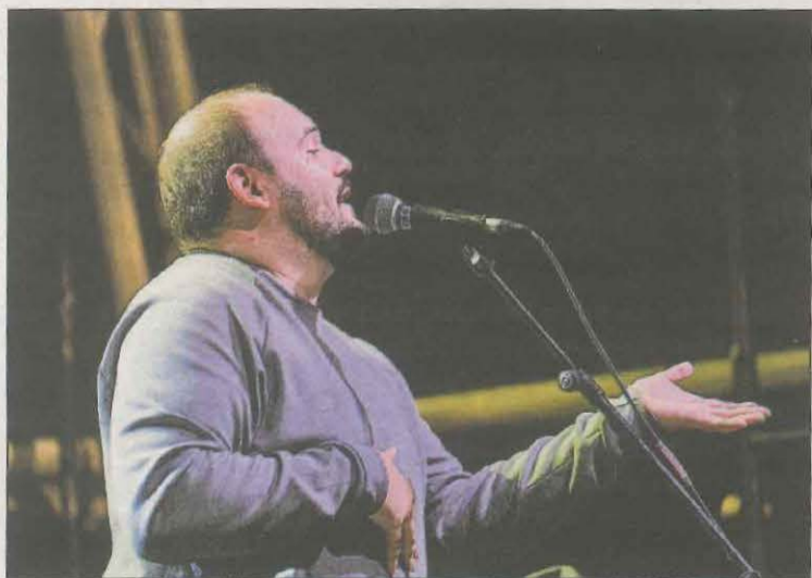
Niño de Elche lleva su 'Concert de música festera'

Niño de Elche y Samantha Hudson son algunos de los más de 30 nombres que se han incorporado a Sónar Barcelona 2022, que se celebrará del 16 al 18 de junio. Estos artistas se suman a Chemical Brothers, The Blaze, Moderat, C.Tangana, Arca, Eric Prydz, Headie One, Morad, Bonobo, Nathy Peluso y Overmono, entre otros.