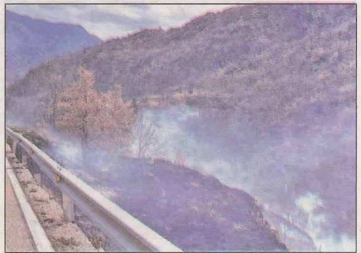
L'incendi es va originar a la zona de Linse

Un contenidor situat a l'altura del número 29 del carrer Jaume I de Tàrraga va quedar ahir calcinat per un incendi que es va originar en el seu interior. En aquest sentit, els serveis d'emergències van ser alertats del foc a les 15.04 hores i ràpidament es va activar el protocol corresponent, desplaçant-se els Bombers de la Generalitat.