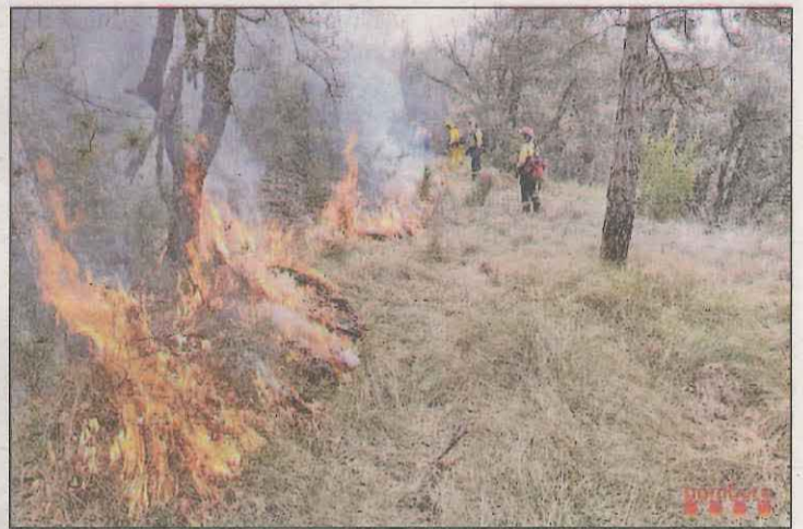
La jornada es va dur a terme a la zona de la Vileta

Un incendi va calcinar ahir 0,05 hectàrees de vegetació a Esterri d'Àneu, concretament a la zona de Linse. En aquest sentit, emergències va ser alertada del foc a les 12.32 hores i fins al lloc es van desplaçar cinc dotacions dels Bombers. D'altra banda, a les Borges van cremar 50 metres quadrats de llenya.