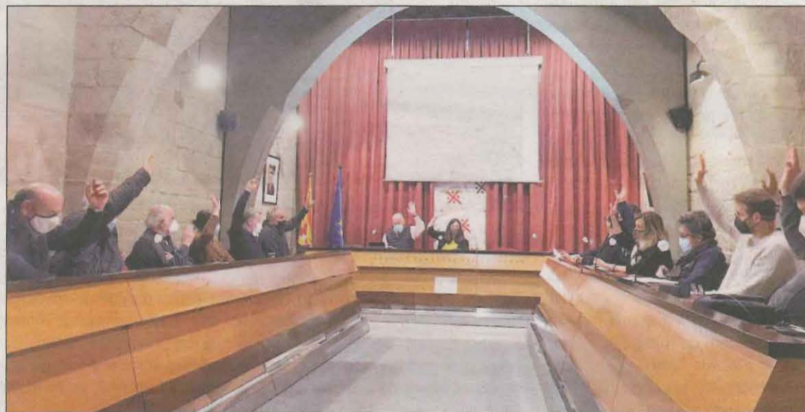
Imatge de la votació de la moció al Consell Comarcal del Solsonès

La moció de la CUP es va presentar en el ple del Consell Comarcal del Solsonès d'aquest dijous al vespre i es va aprovar per unanimitat de tots els grups -ApS-CUP, Junts, ERC i Independents-. El text insta el Govern de la Generalitat a incloure el Solsonès, el Ripollès i el Berguedà en la consulta oficial sobre els JJOO d'Hivern i, si no és així, demana al Consell Comarcal que organitzi una consulta pròpia per "conèixer