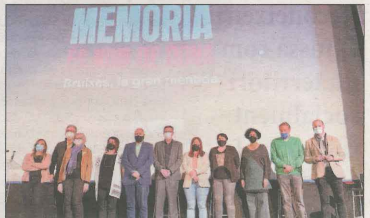
L'acte es va fer al cinema Casal de la capital de la Segarra

Pels republicans, realitzar aquesta actuació a l'N-260, hauria de ser "una de les prioritats del govern espanyol" a Catalunya. També es vetllarà perquè la part catalana ho segueixi en la comissió bilateral Estat-Generallitat de Catalunya.