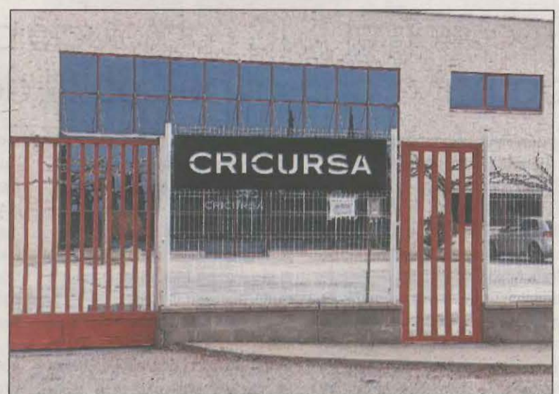
Exterior de les instal·lacions de Cricursa