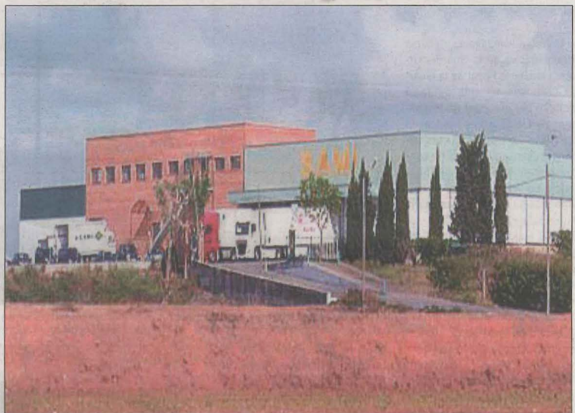
Els sindicats valoren "positivament" l'acord després de dies d'intenses negociacions

L'escorxador de Vallfogona de Balaguer també ofereix a la plantilla recol·locar onze persones entre una fàbrica de pinsos i algunes oficines, i una vintena més en escorxadors de la Costa Brava que té el Grupo Cañigueral-Costa Brava Mediterranean Foods, principal accionista de Sami. Des de CCOO valoren que l'acord final millora les condicions dels treballadors una vegada es va con-