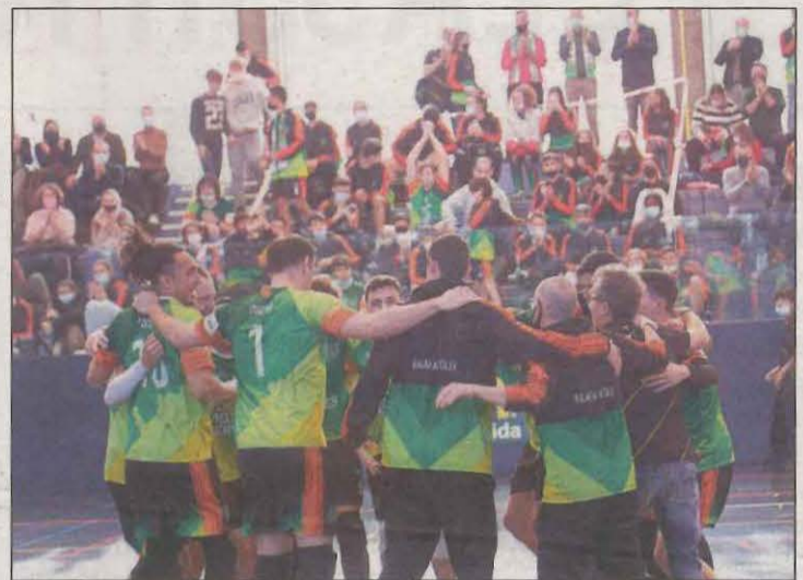
El equipo verde jugará la fase de ascenso