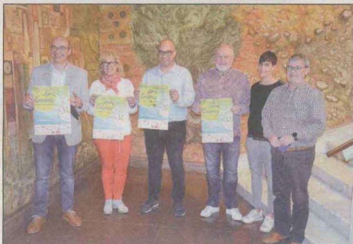
La Diputació va acollir la presentació de l'acte