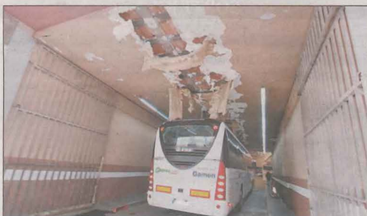
Los destrozos eran evidentes ayer en la estación

El vehículo realizaba tareas de rehabilitación en el interior de la estación recientemente recuperada por la Paeria y quedó enganchado en el acceso a causa de su altura. LOCAL | PÁG.9