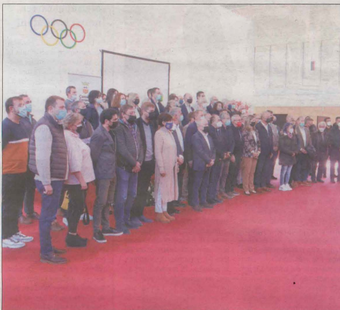
Imatge d'arxiu de la conferència a favor dels JJOO amb representants d'ajuntaments i consells