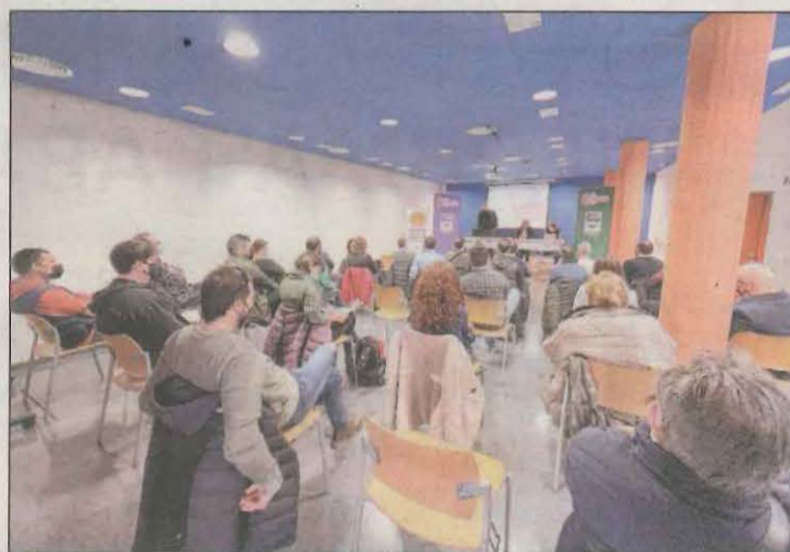
El sindicat busca apropar-se als seus delegats territorials

ge 2022' tindrà lloc aquest pròxim dimecres 30 de març amb la presentació del llibre 'Formatgeries artesanes de Catalunya. Rutes per 93 obradors', de Ramon Roset. L'acte s'iniciarà a les vuit del vespre a les mateixes instal·lacions d'aquest equipament museístic de la capital alturgellenca. L'entrada és lliure. El cicle seguirà dissabte 9 d'abril, a les 16.00 hores.