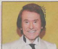
El cantante Raphael

Lleida presenta el Magnífic Fest, que contará con Raphael, Tanxugueiras y Nil Moliner | PÁG. 29