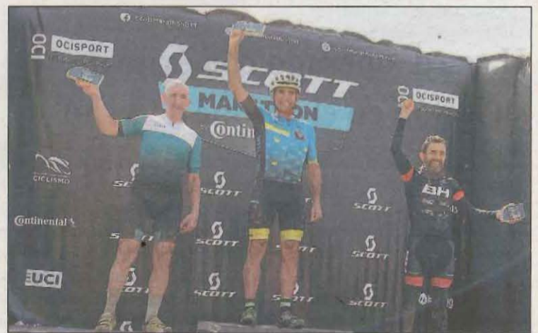
El leridano subió a lo más alto del podio