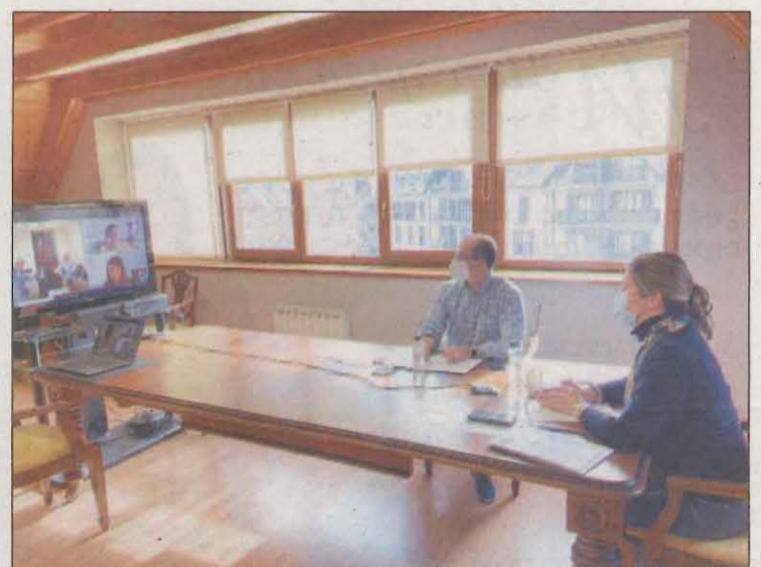
Imatge de la reunió que es va celebrar ahir

Departament de Cultura per a la revisió i actualització del traspàs de competències, un afer molt urgent per al govern del Conselh Generau d'Aran, atès que aquesta competència no s'ha actualitzat des de 1992. La síndica va tornar a reclamar que el Departament de Presidència modifiqui l'assignació del Conselh per a 2022 amb la incorporació dels més de 280.000 euros restants de l'aportació addicional de polítiques pròpies. Aquest òrgan té com a objectiu l'impuls i la preparació de propostes de traspasos que s'hagin d'elevat al Ple de la Comissió, així com l'estudi de propostes de convenis i altres instruments de col·laboració.