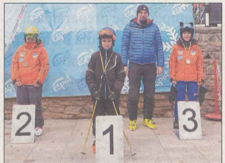
Uno de los podios de la jornada