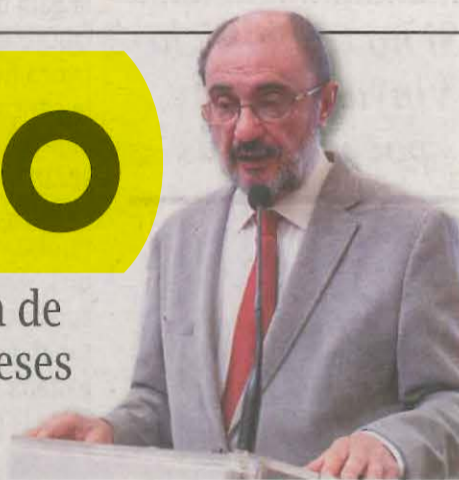
El presidente de Aragón, Javier Lambán

► La Generalitat califica la decisión de "despropósito" y la vincula a "intereses electorales" del dirigente socialista