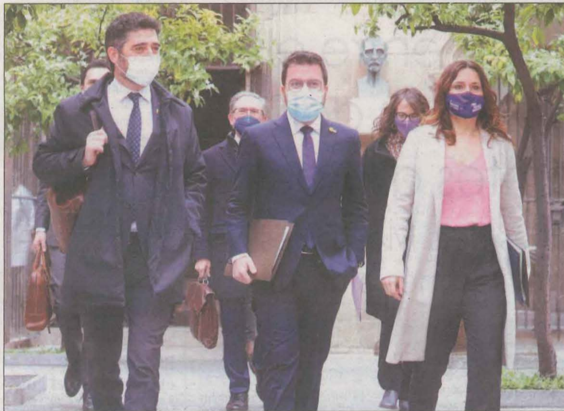
El president i els consellers entrant al Consell Executiu celebrat ahir dimarts

Tot i no voler avançar els detalls de la proposta que l'Aragó posarà sobre la taula, sí que ha deixat clar que "no beneficiarà l'Aragó de manera descarada". I va afegir que "hi ha bastant diferència" entre el repartiment de modalitats que ha donat per bo el COE i el que ell creu que seria just. Lambán va insistir que la candidatura ha de ser en termes