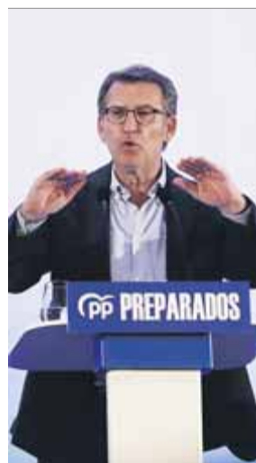
Núñez Feijóo, ahir en l'acte del PP a Barcelona