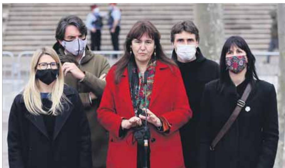
La presidenta del Parlament, ahir al TSJC per acompanyar la consellera de Cultura